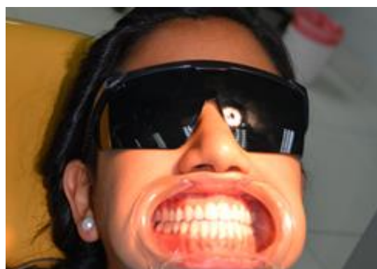
Imagen 3 y 4. protección ocular del paciente y odontólogo