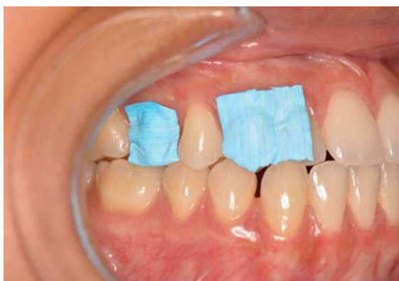
Imagen 5. Aislamiento con teflon