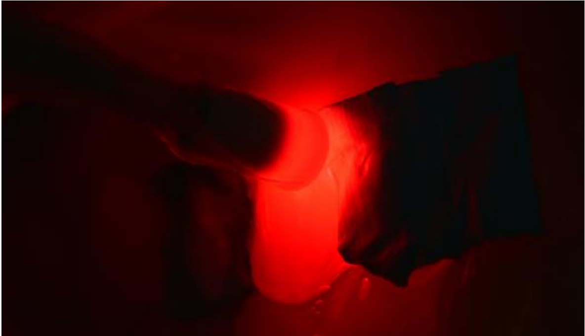
Imagen 9. Aplicación de láser terapéutico en cervical de la pieza.