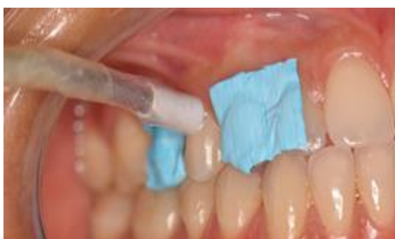
Imagen 7. Ubicación de la punta del láser en cervical