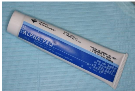
Imagen 1 y 2. Profilaxis con escobilla y pasta profiláctica