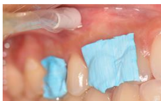
Imagen 8. Ubicación de la punta del láser a nivel apical