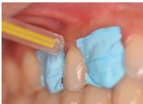
Imagen 6. Estimulo con aire frio con la jeringa triple