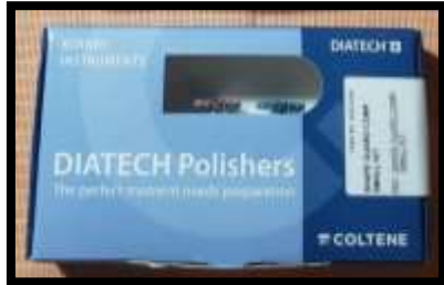
Figure 1. Sistema de Pulido Diatech