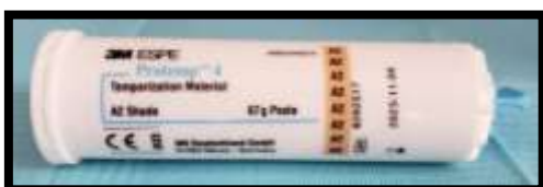
Figure 5. Resina Provisional Protemp 4