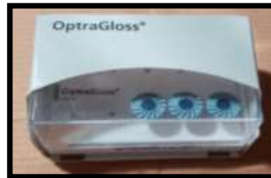
Figure 2. Sistema de Pulido Optragloss