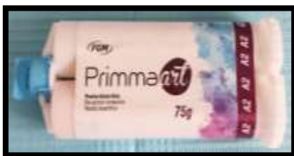
Figure 3. Resina Provisional Primmart