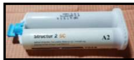
Figure 4. Resina Provisional Structur 2