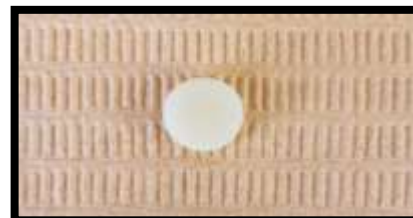
Figure 6. Muestra