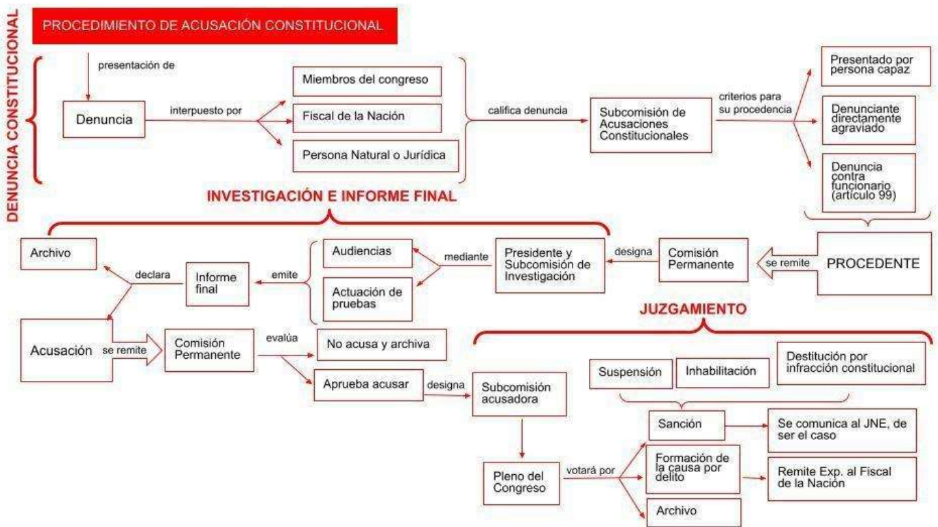
Gráfico 1: Procedimiento de Acusación Constitucional

Frente a esta premisa, cuando se haya determinado en qué infracción o delito ha incurrido el presidente, se podrá iniciar un procedimiento de acusación constitucional, conforme lo establece la Constitución. Además, corresponderá aplicar lo contemplado en el artículo 89 del Reglamento del Congreso, el cual desarrolla de manera amplia este procedimiento. En este caso, García, V. (2011) indica que este trámite se debe dar en 3 partes. Este procedimiento se divide en denuncia constitucional, investigación y juzgamiento (págs. 256-258), cómo se apreciaría en el gráfico siguiente.