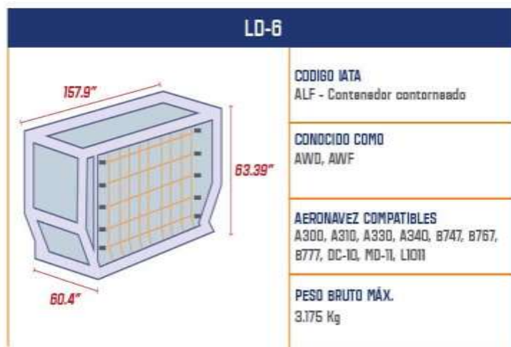
Dimensiones del contenedor