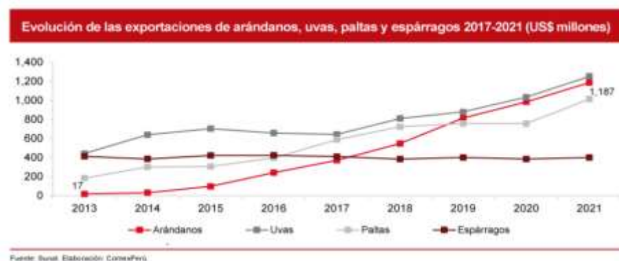
Desarrollo de los envíos internacionales de arándanos peruanos 2013-2021 (US$ MILLONES)

Nota. El presente gráfico detalla el avance de las exportaciones de arándanos entre el 2013 y 2021, años en los cuales las exportaciones de este fruto alcanzaron un crecimiento promedio al año del 70%. En el 2021, el arándano peruano representó un 25.2% del total comercializado a nivel mundial. Datos tomados de la Sociedad de Comercio Exterior del Perú (COMEXPERÚ, 2022).