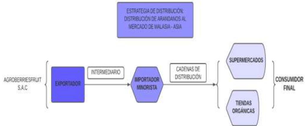
Gráfico resumen de la estrategia de distribución para la empresa AGORBERRIESFRUIT S.A.C

Nota. Diagrama de flujo aplicado a la propuesta de distribución.