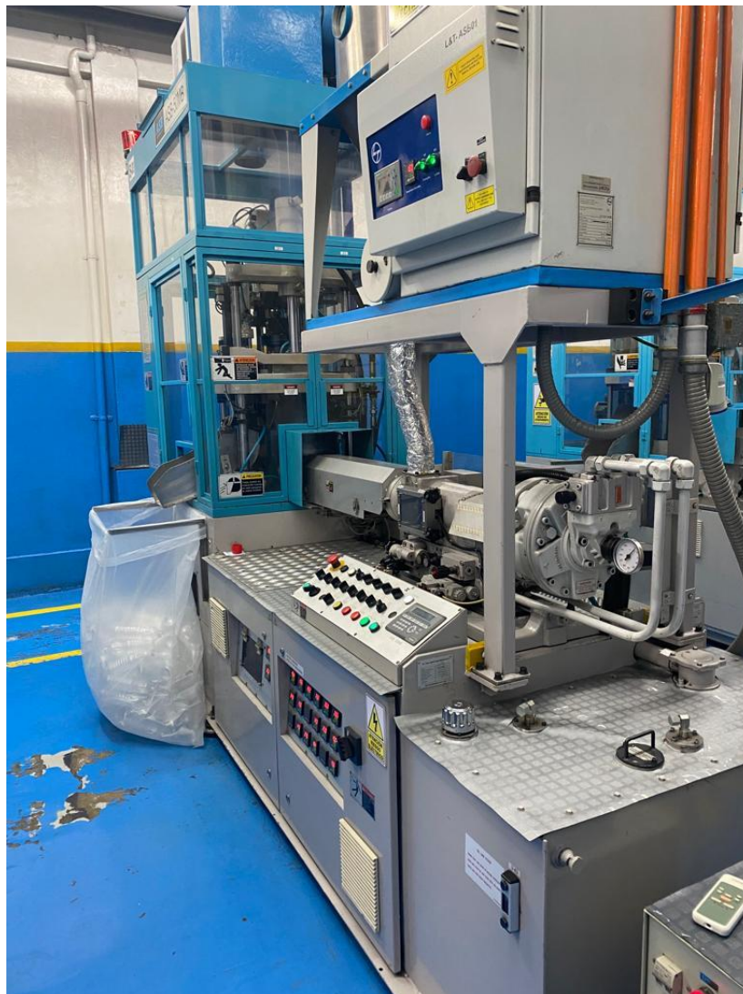
Figura 1. Máquina Sopladora de botellas de plástico