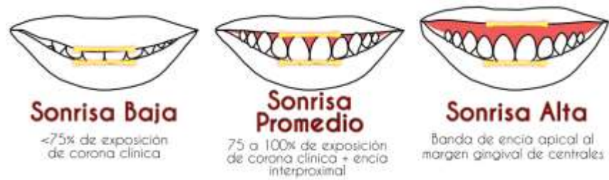
Figura 1. Clasificación de Tjan de los 3 tipos de sonrisa.