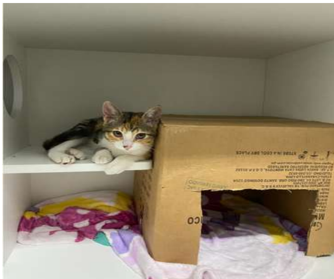
Figura 1. Jaula para gatos con enriquecimiento ambiental

Las características de los gatos en el estudio fueron descritas mediante estadísticos de resumen (frecuencias para datos categóricos y media \pm desviación estándar o mediana y rangos para datos numéricos) y comparados según grupos experimentales con análisis estadísticos bivariados según corresponde. Se presentaron los parámetros de evaluación anestésica (PAS, FC, FR, TR) antes de la pre-medicación (M0), inmediatamente luego de la pre-medicación (M1), inmediatamente luego de la inducción anestésica (M2) y luego de la intubación (M3), los cuales fueron resumidos utilizando media \pm desviación estándar y además presentados gráficamente. En cada tiempo de evaluación se compararon los parámetros anestésicos según grupos experimentales mediante análisis de T Student para grupos independientes. Asimismo, se calcularon las diferencias absolutas de los parámetros entre los períodos de inducción anestésica e intubación (M2-M3), los cuales fueron también comparados según grupos experimentales mediante análisis de T Student. Todos los análisis fueron realizados en el paquete estadístico Stata IC/16 (Stata Corp., College Station, TX) y se consideró un nivel de significancia de 5%.