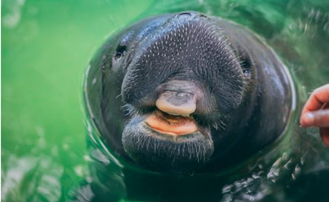
Figura 1. Manatí amazónico ( Trichechus inunguis ) rehabilitado en el Centro de Rescate Amazónico (CREA).

El manatí amazónico recibe su nombre por la falta de uñas en sus aletas pectorales a comparación de las otras especies, y además cuentan con parches de coloración rosadas o blancas en su barriga (Rosas, 1994) (Fig. 2).