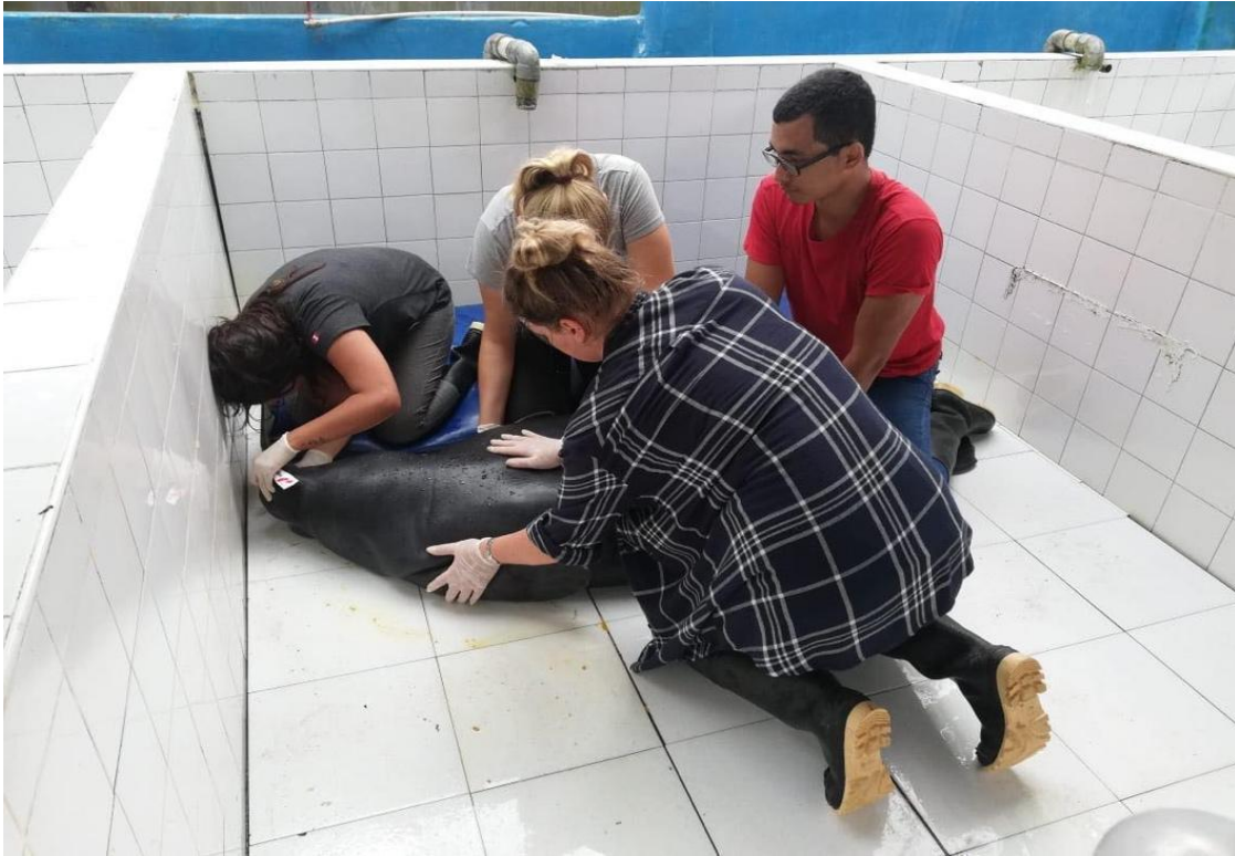
Figura 3. Voluntarios del Centro de Rescate Amazónico rehabilitando a un manatí.

El rescate, rehabilitación y liberación de animales heridos o enfermos se ha convertido en una práctica muy conocida entre los programas de manejo de animales silvestres (Adimey et al. , 2012). Los manatíes que llegan a este centro provienen de los decomisos o labores de rescate que realiza la Dirección Regional de la Producción del Gobierno Regional de Loreto (DIREPRO- LORETO), y son trasladados para iniciar un proceso de rehabilitación (Perea-Sicchar et al. , 2011).