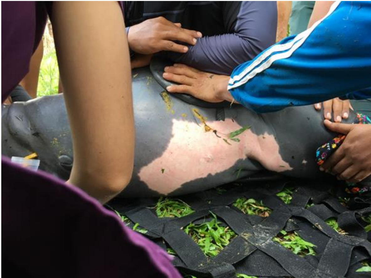
Figura 2. Parche de coloración rosada en la barriga de un manatí amazónico.

Es una especie exclusiva de la cuenca Amazónica y puede encontrarse en países como Brasil, Ecuador, Perú e inclusive, aunque con muy pocos registros; en Colombia (Hidalgo, 2010). En distintos países incluyendo al Perú, el manatí amazónico es considerado una especie de alto valor ecológico, cultural y biológico, principalmente por ser un importante fertilizador a través de la liberación de nutrientes en su orina y heces que son luego absorbidos por el fitoplancton (Tófoli, 2012). Igualmente, los manatíes son considerados grandes controladores biológicos de plantas acuáticas como Eichhornia crassipes (Solms-Laubach, 1883) y Pistia stratiotes (Linnaeus, 1753) ya que son capaces de comer hasta 50 kg de plantas diarias (Elcacho, 2013; Landeo-Yauri, Castelblanco-Martinez & Williams, 2017). A pesar de todos los beneficios de esta especie en el ecosistema, su conservación es un tema relativamente nuevo en Perú.