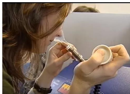
Figura 4. Panelista certificado