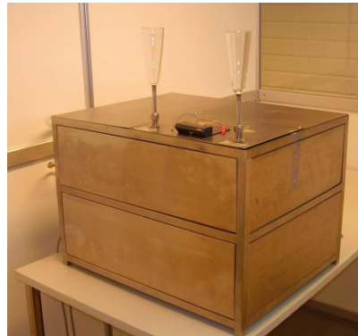
Figura 3. Olfatómetro dinámico

2017). A partir de estos datos se puede realizar modelamientos de la pluma de dispersión del olor (Goektas, Fleiner, Sedlmaier, & Bauknecht, 2009).