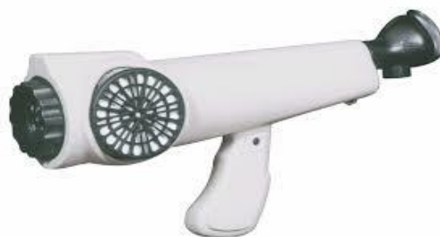
Figura 5. Olfatómetro de campo

La olfatometría de campo es una metodología en desarrollo que se basa en la cuantificación de las molestias de olor a través de un dispositivo portátil llamado Nasal Ranger (Figura 5), pero conocido comúnmente como nariz electrónica. Dicho equipo se encuentra, actualmente, avalado por la Directiva Europea IPPC (Socioingeniería, 2012) y funciona bajo el criterio de dilución hasta el umbral (D/T) (P. Giungato et al., 2018) que es el cociente del volumen de aire filtrado y el aire oloroso mediante una serie de filtros de carbón activado que diluyen el olor ambiental progresivamente (Walgraeve, Van Huffel, Bruneel, & Van Langenhove, 2015).