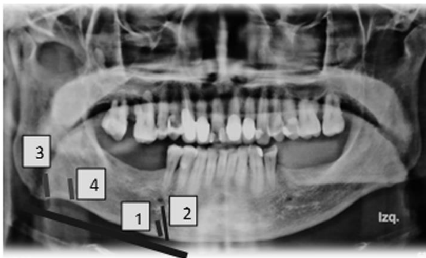
Fig. 3 Ancho cortical mandibular (ACM) 1, índice mandibular panorámico (IMP) es la diferencia entre 2 y 1, índice gonial (GI) 3, índice antegonial (AI) 4, donde 3 y 4 evalúan el grosor mandibular en la parte posterior y anterior de la rama.