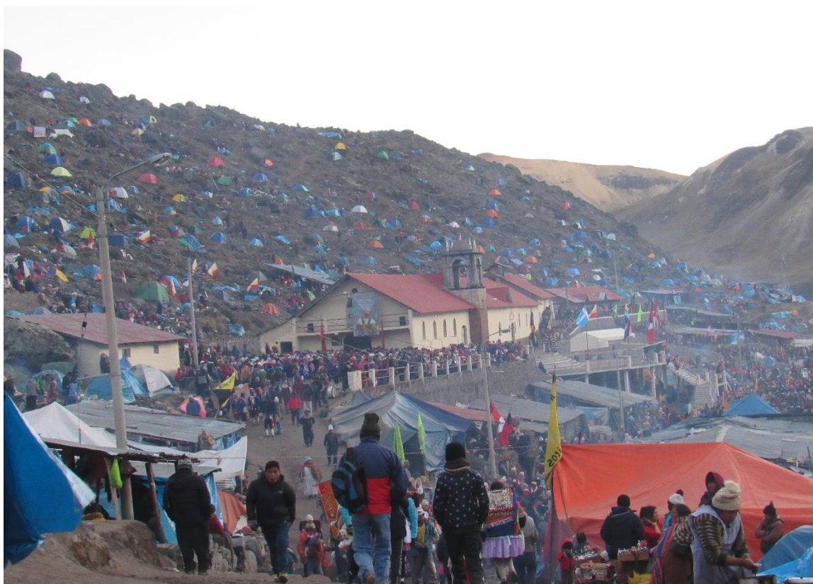
Figura 5. Vista del Templo del Señor de Qoyllur Ritti y alrededores.