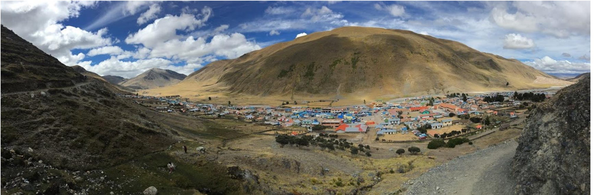
Figura 1. Vista panorámica del poblado de Mahuayani. Lugar del camino donde se toma la foto (camino A), este tramo es más corto pero más empinado. En la parte izquierda de la imagen se aprecia parte del otro sendero (camino B), es más largo y plano. Por ahí también pasan las acémilas ya que ese camino es más ancho.