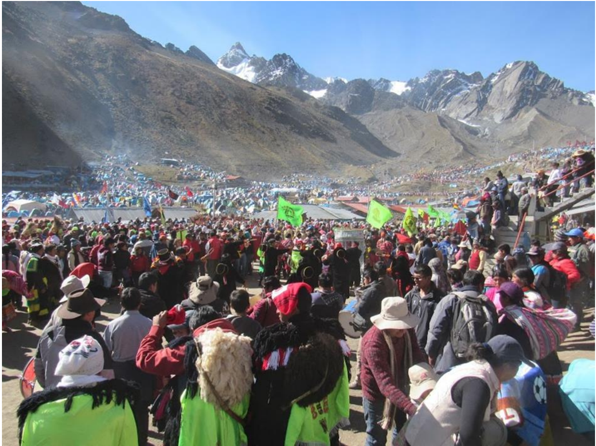
Figura 4. Qoyllur Riti, 2018. Día Central.