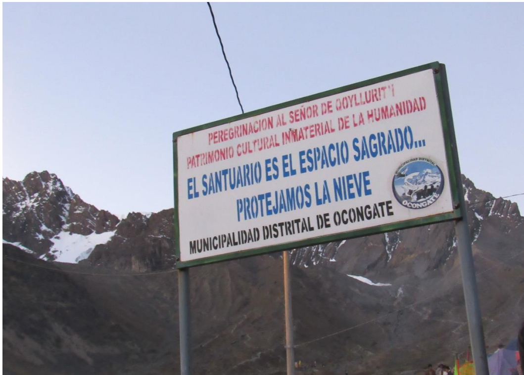
Figura 8. Letreros que promueven la protección de los nevados.