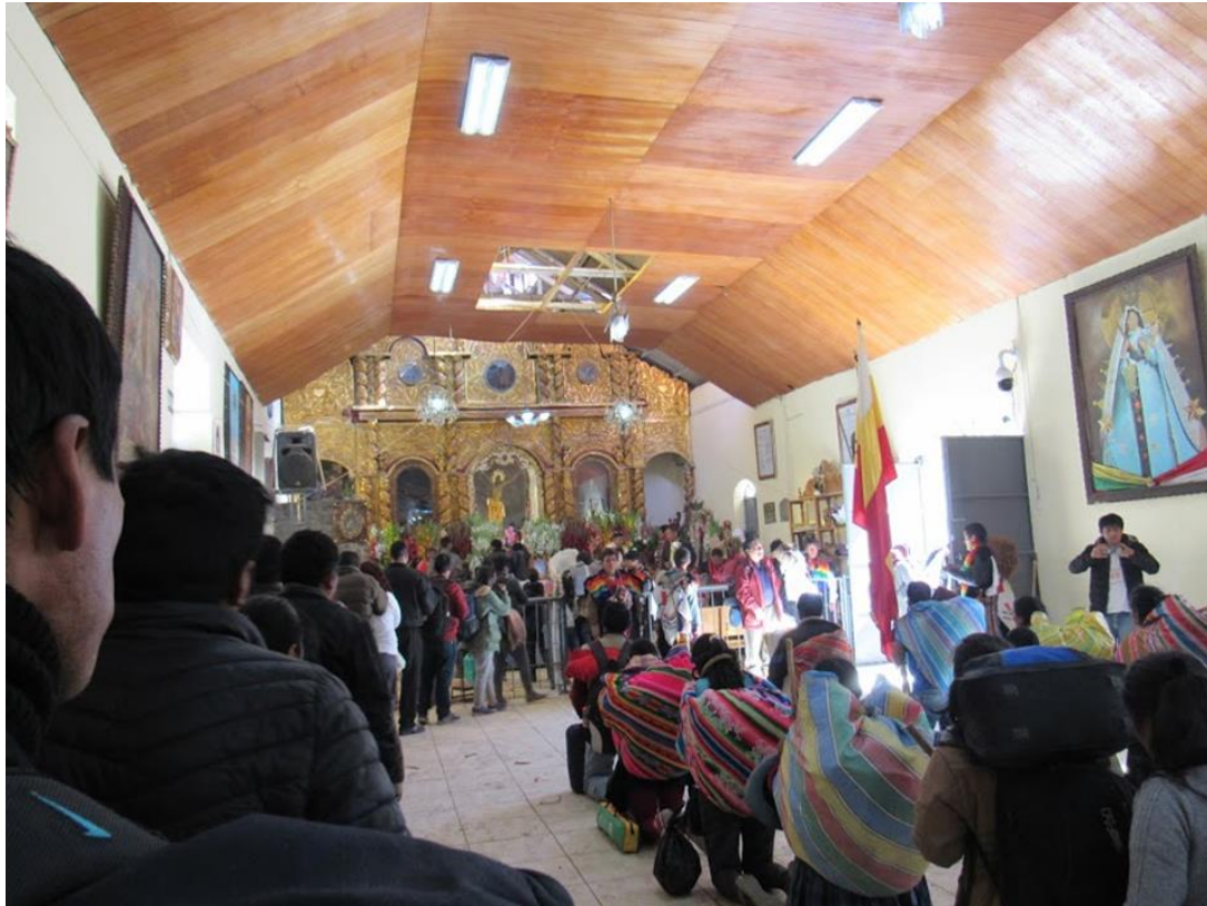
Figura 6. Interior del Templo del Señor de Qoyllur Ritti. En ese momento las personas están despidiéndose.