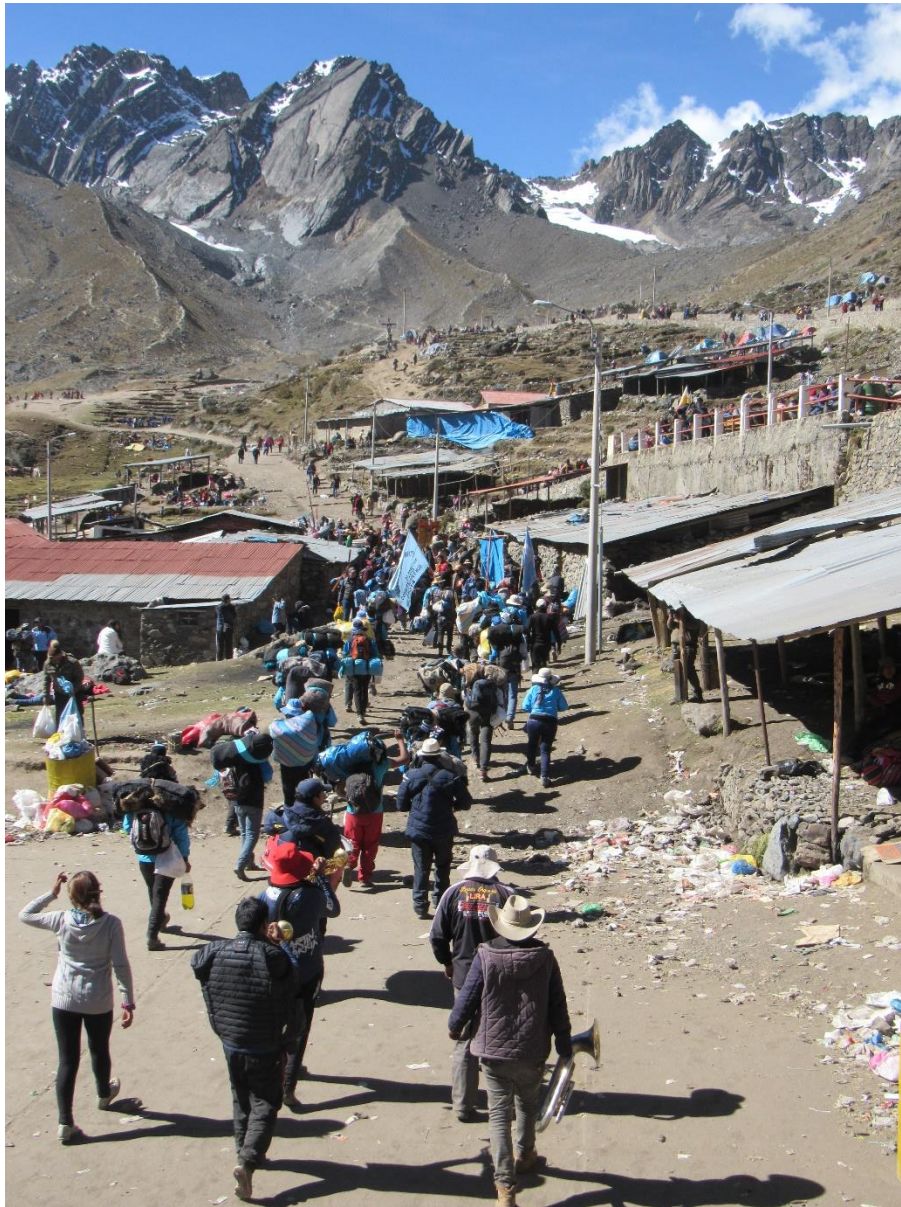
Figura 10. Comparsa dirigiéndose al Templo para despedirse. También puede observarse la basura acumulada a los lados del camino.