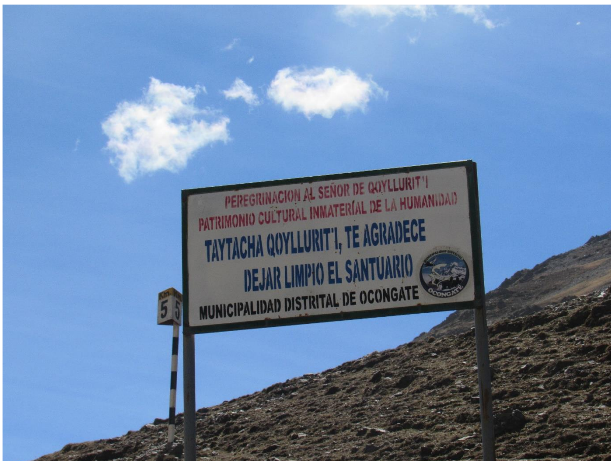
Figura 9. Letreros que promueven la limpieza del Santuario.