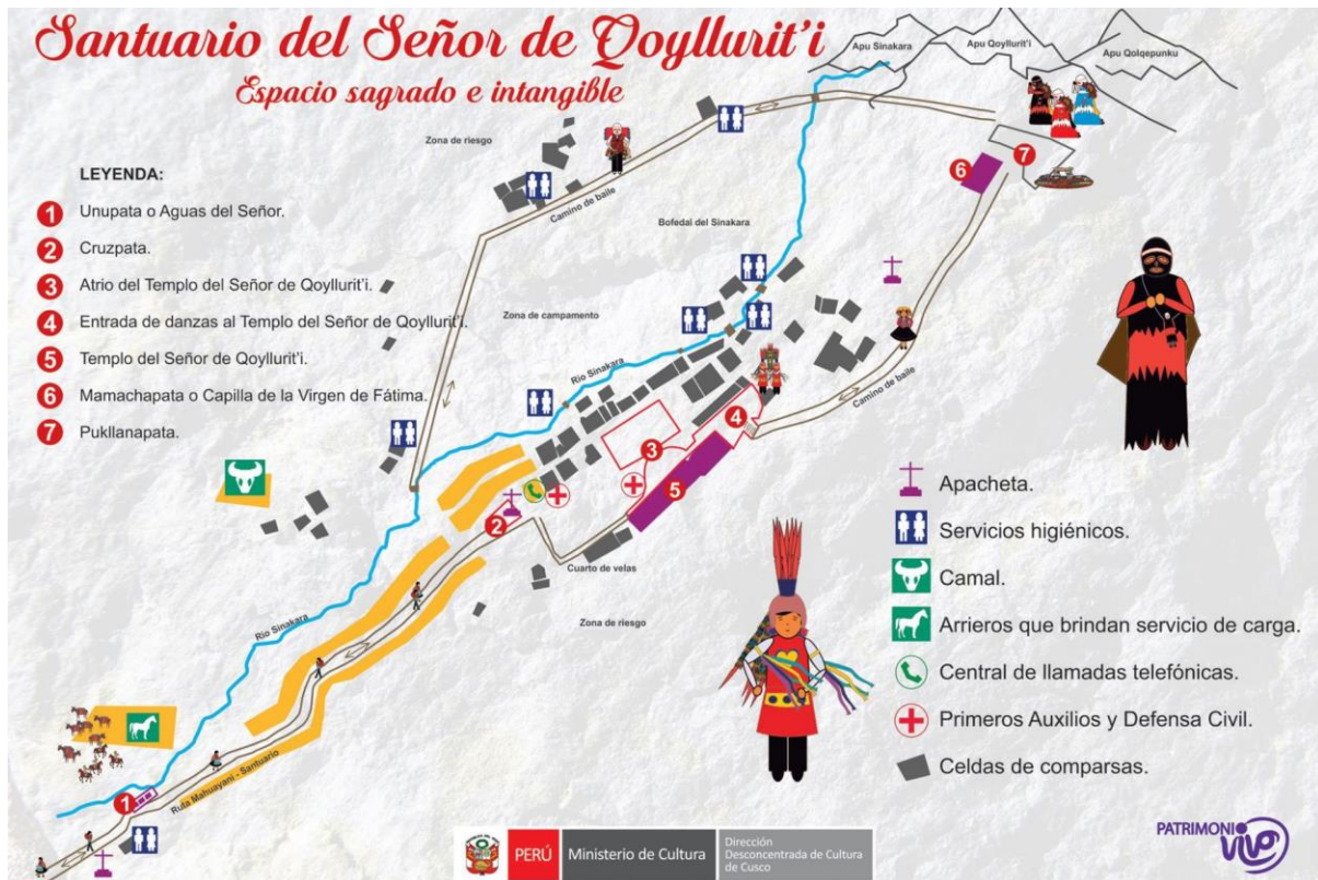
Figura 2. Croquis del recorrido desde Mahuayani hasta el Santuario del Señor de Qoyllur Ritti y principales puntos de interés.