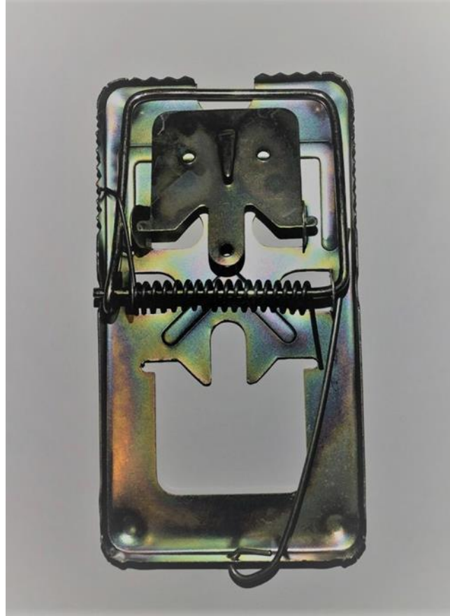
Figura 1. Trampa de captura muerta tipo guillotina de metal