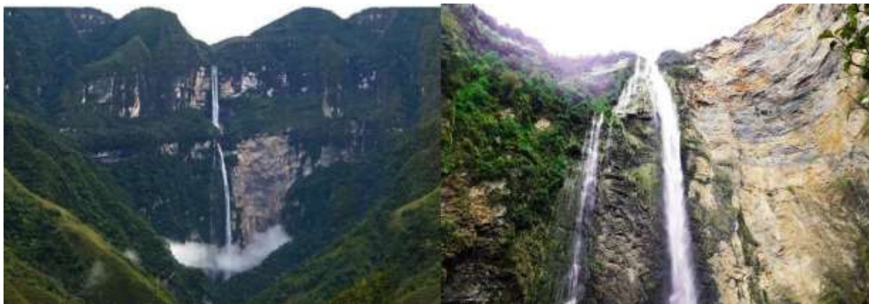
Figura N° 15. Catarata de Gocta.