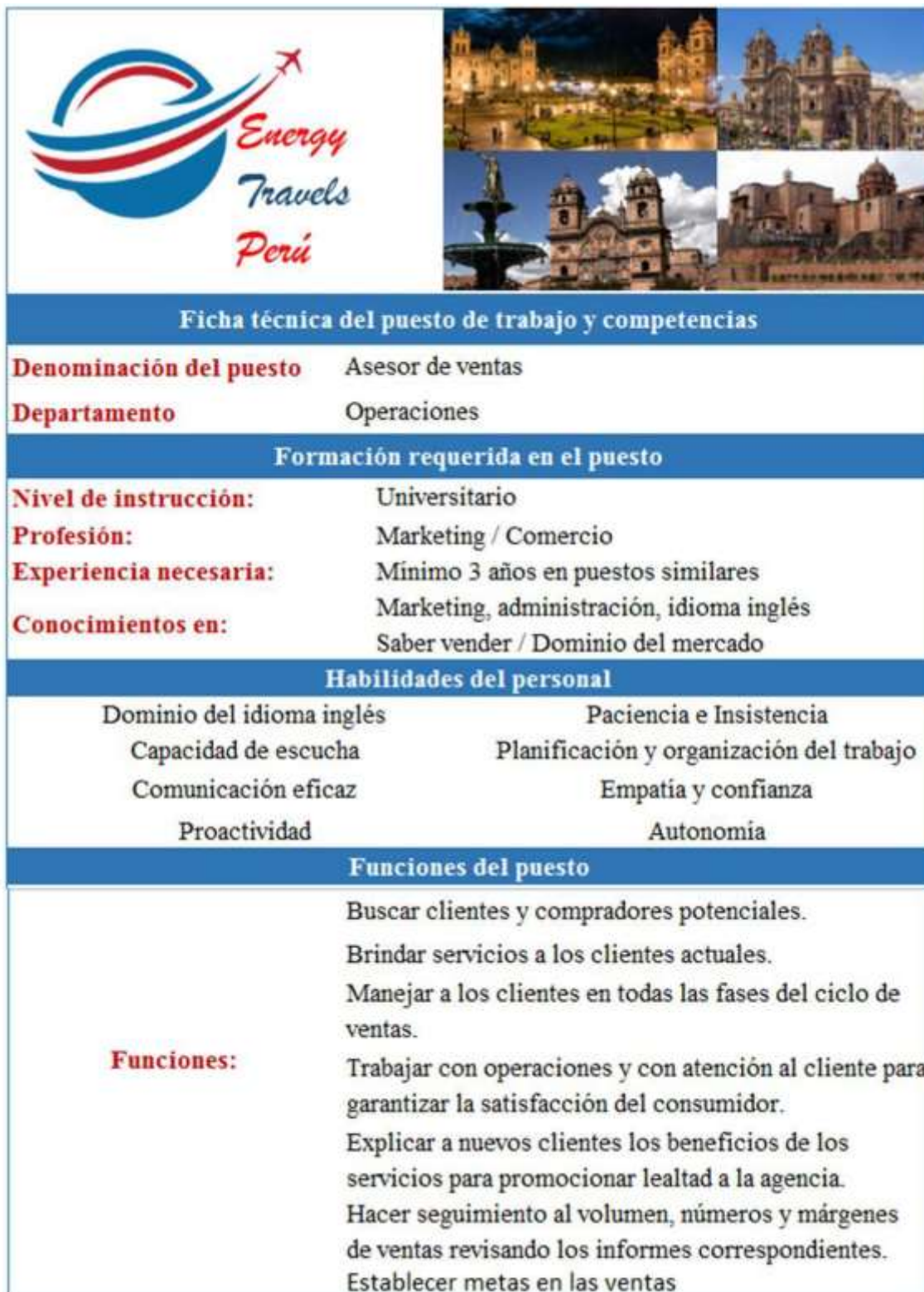
Figura N° 23 Ficha técnica del puesto de trabajo de asesor de ventas.