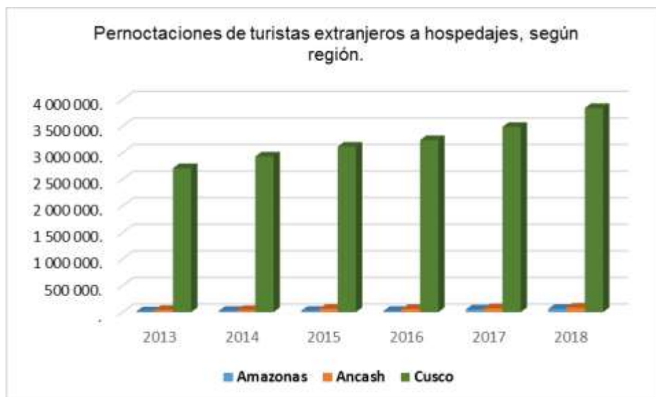
Figura N° 4. Pernoctaciones de turistas extranjeros a hospedajes, según región.