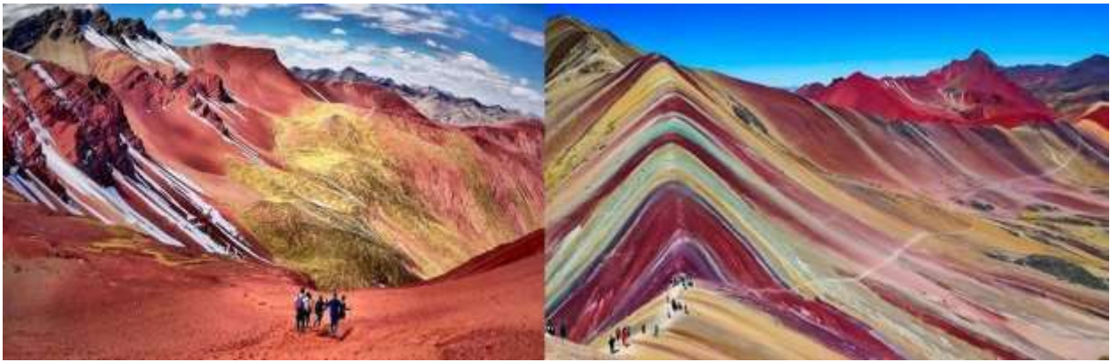
Figura N° 7. Valle rojo de Pitumarca y la Montaña de los siete colores de Palcoyo.