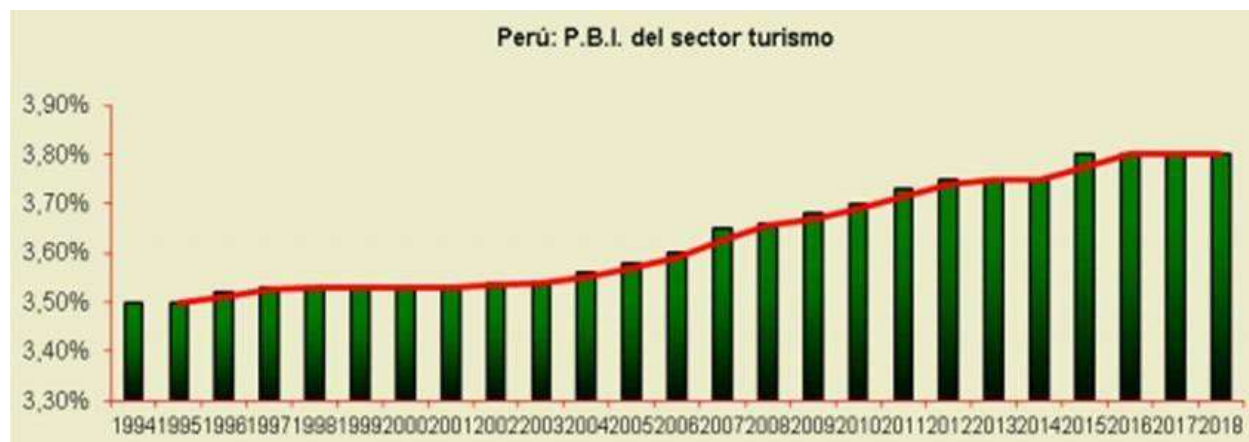
Figura N° 1. Perú: P.B.I. del sector turismo