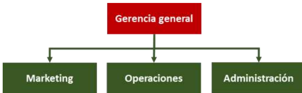
Figura N° 20. Organigrama de Energy Travels Perú.

operaciones. Comprende los departamentos de Marketing, Operaciones y Administración. El que más personal requiere es el de Operaciones por cuanto es donde se atenderán a los clientes de forma personalizada, ya sea a través de correos electrónicos, mensajes de texto, redes sociales o de forma personal cuando el cliente se dirija a la oficina física ubicada en Lince. La figura 18 muestra el organigrama establecido para los primeros años.