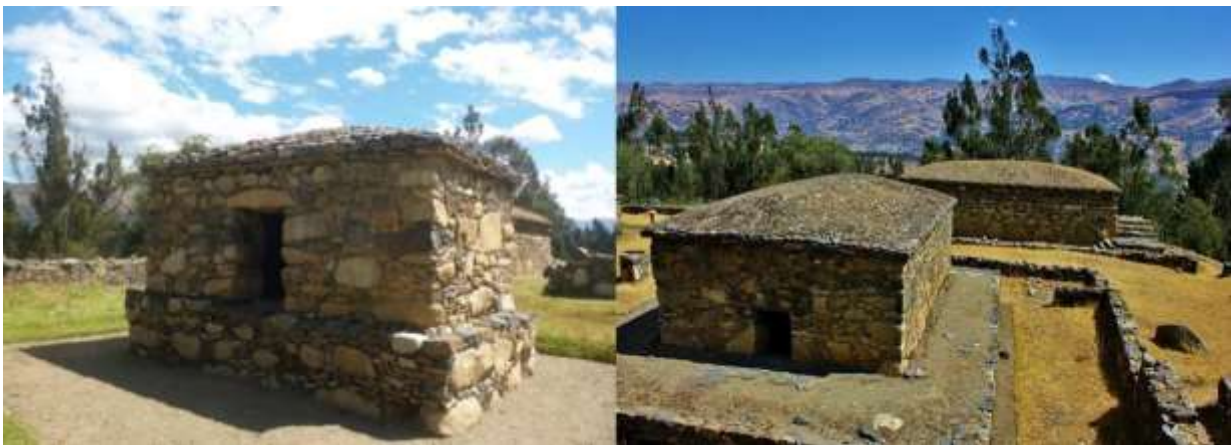
Figura N° 12. Monumento arqueológico Willkawaín.

El paquete comprende las entradas a todos los sitios turísticos a visitar: