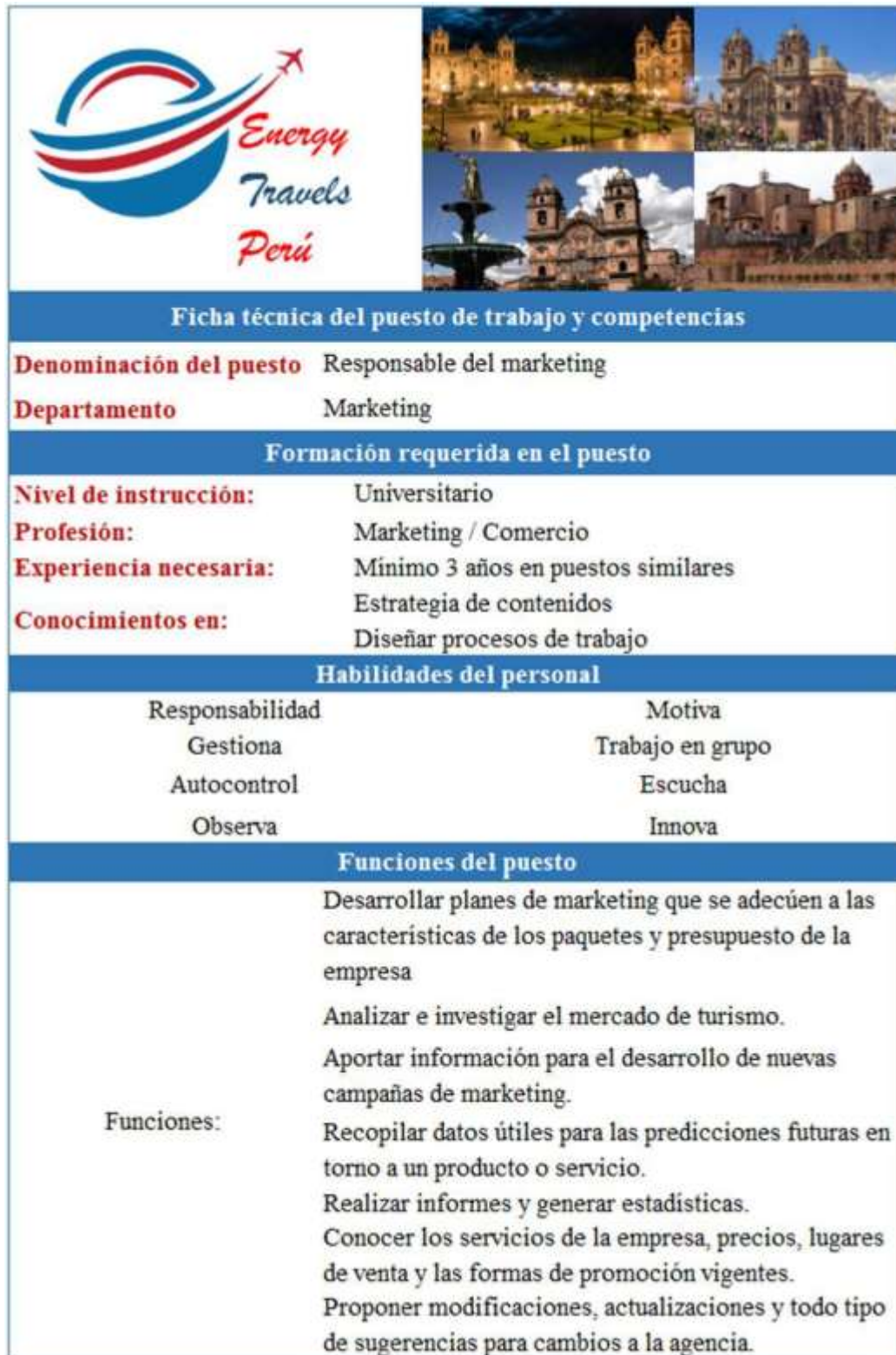
Figura N° 24 Ficha técnica del puesto de trabajo de responsable de marketing.