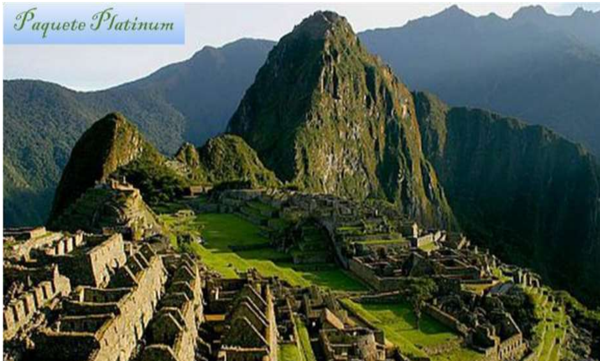
Figura N° 9. Ciudad Inca de Machu Picchu.