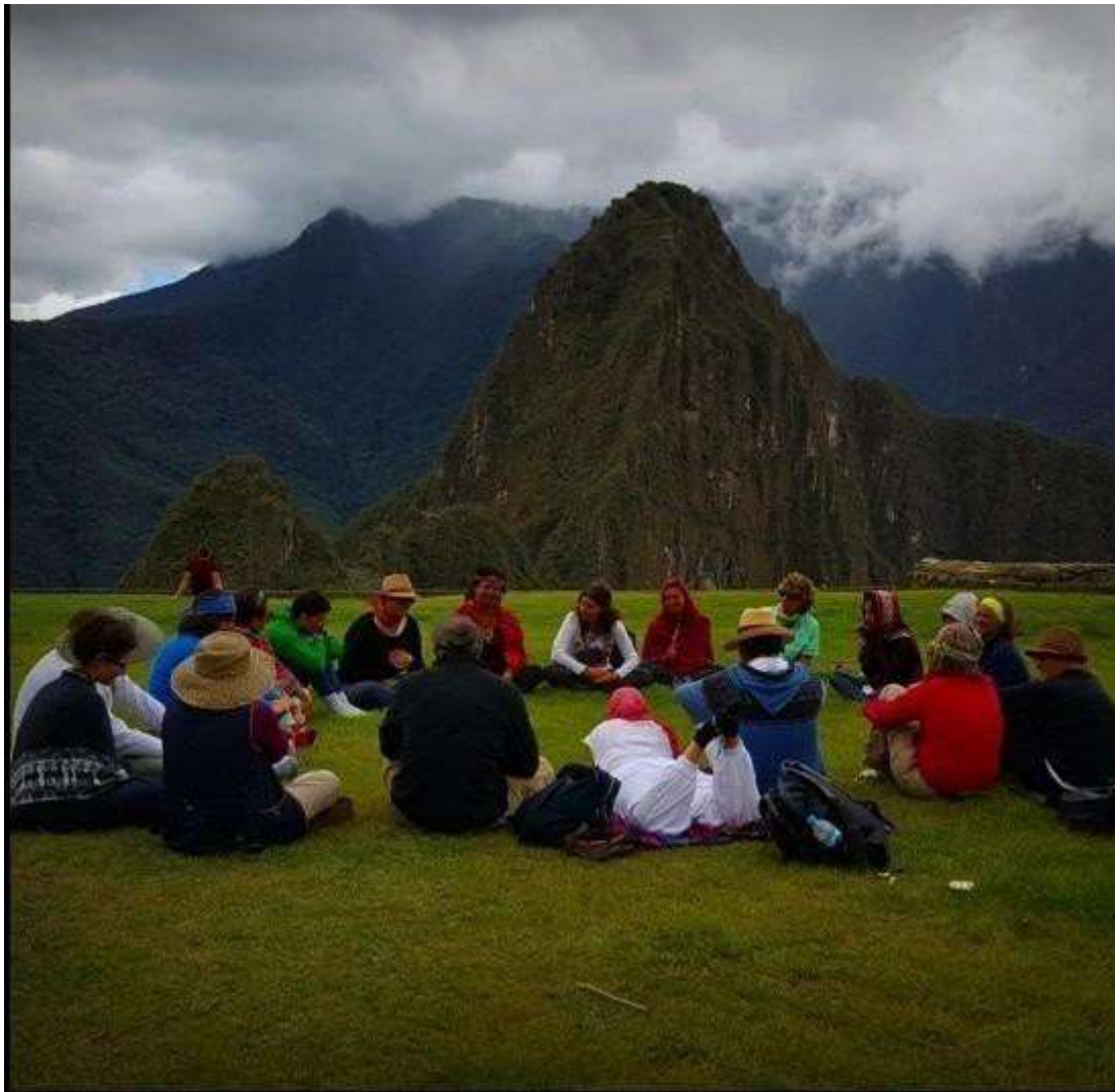
Figura N° 8. Dinámicas de sanación energética