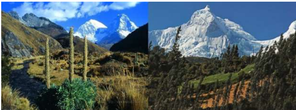
Figura N° 13. Parque Nacional Huascarán

El paquete contempla las entradas a todos los sitios turísticos a visitar.