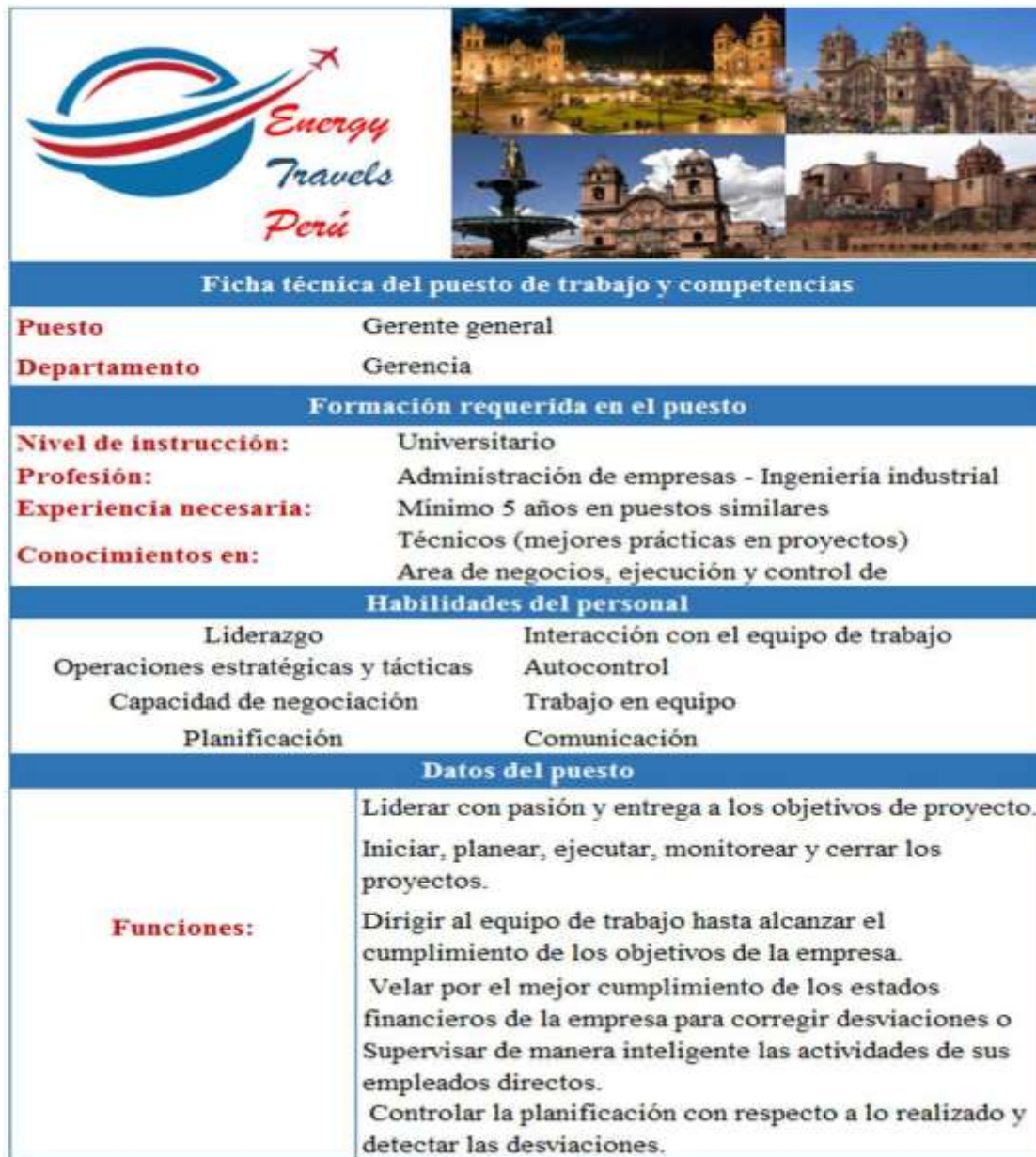
Figura N° 21. Ficha técnica del puesto de trabajo de gerente.