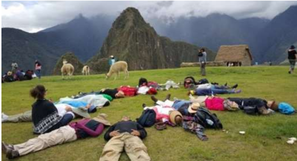
Figura N° 10. Dinámicas de sanación energética.