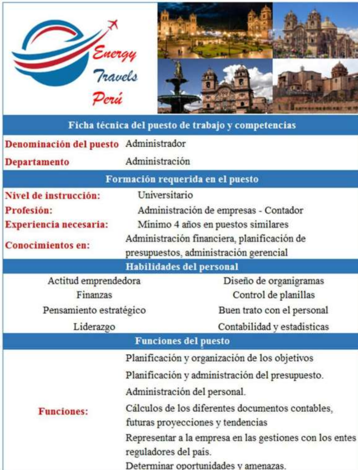
Figura N° 22 Ficha técnica del puesto de trabajo de administrador.