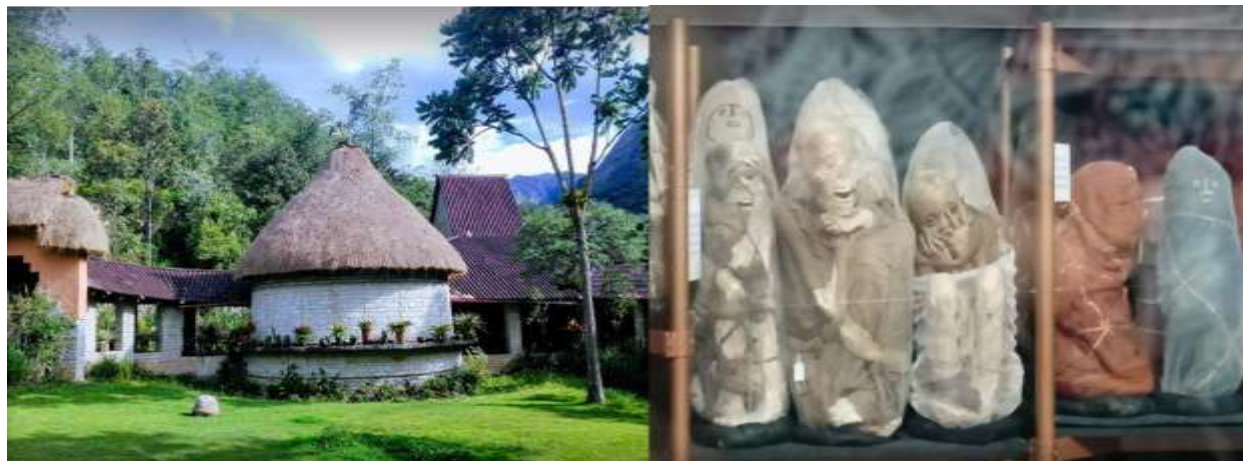
Figura N° 16. Museo de Leymabamba.

El paquete contempla el pago de las entradas de todos los sitios turísticos a visitar.