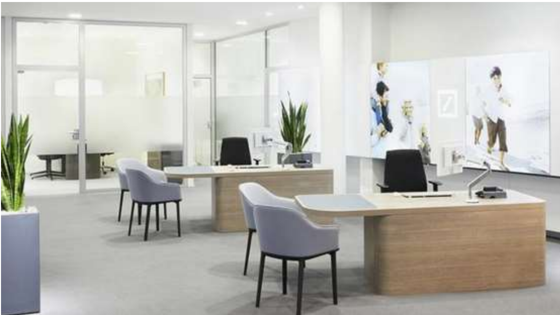
Figura N° 17. Planeación de las oficinas de atención al cliente dentro del local

Alquiler del local para oficina. Para instalar la agencia física se requiere un local para la atención del cliente, el cual será alquilado en el distrito de Lince, específicamente en el primer nivel de un edificio en la Av. Petit Thouars. Región de Lima. Posteriormente, se procederá a su remodelación y adecuación del espacio físico requerido para ofrecer una magnífica atención a la clientela, proceso que incluye la compra de mobiliario, como se ilustra en la figura 15.