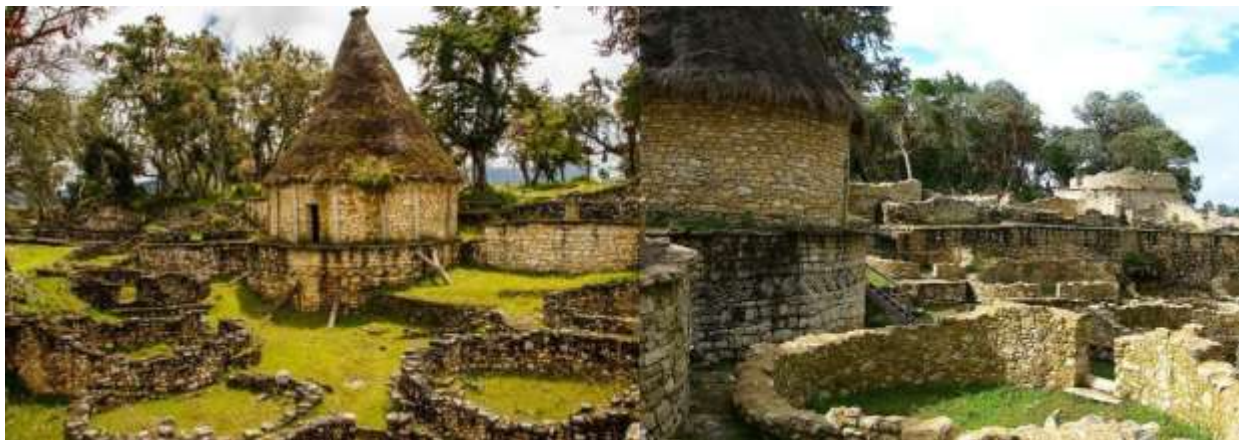
Figura N° 14. Complejo arqueológico de Kuélap.

Disfrutarán de cuatro días y tres noches para disfrutar de espectaculares sitios de la región.