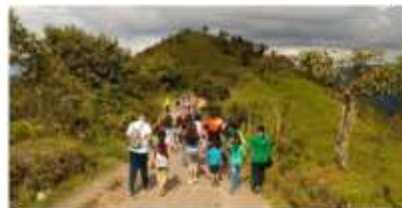
Figura N° 26 Actividades que comprenden las visitas del paquete Energía de Ancash.