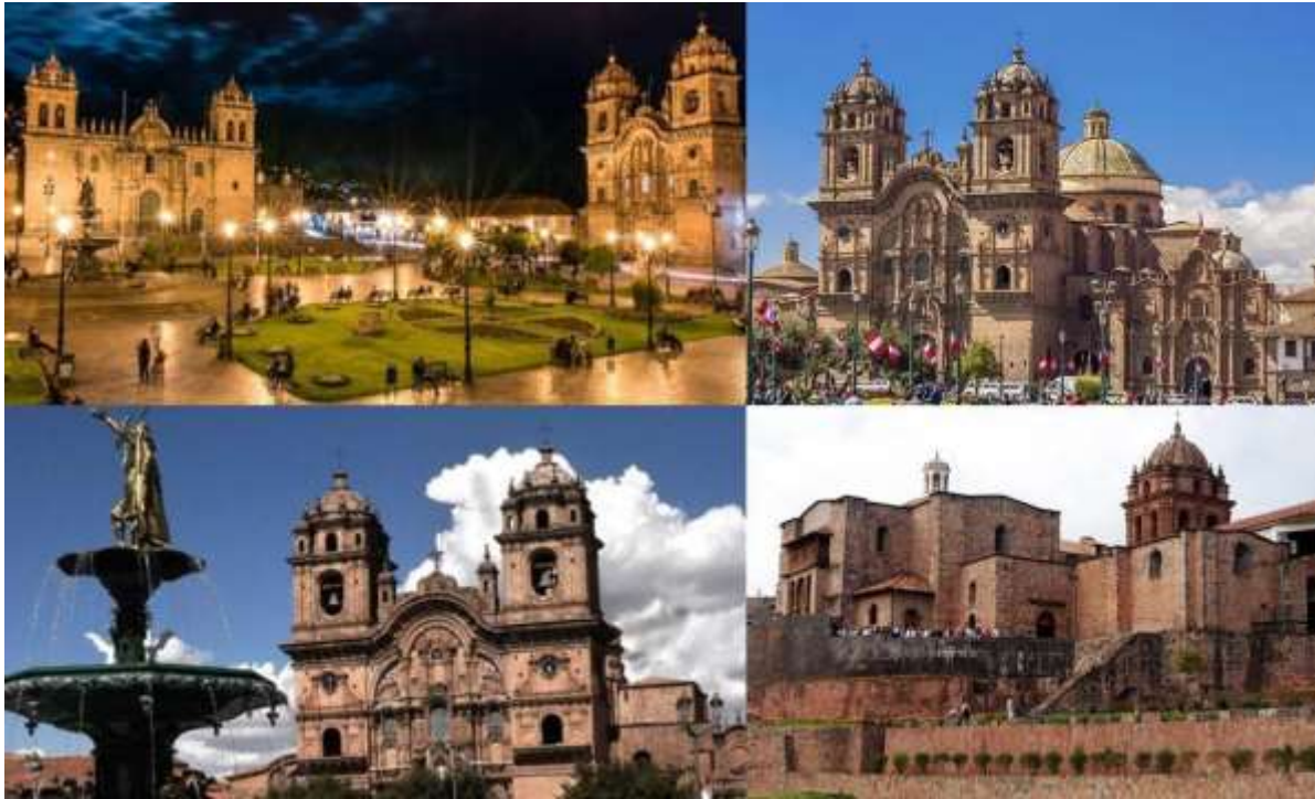
Figura N° 6. City tour en la ciudad del Cusco.

A continuación, se indican los detalles del servicio.