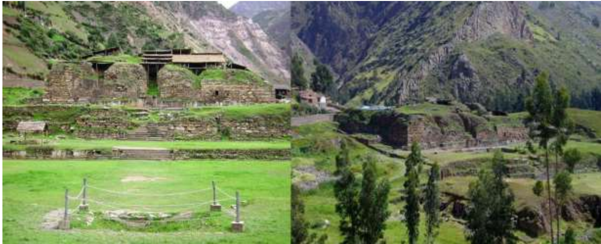
Figura N° 11. Monumento arqueológico Chavín de Huantar.

El paquete contempla las entradas a los sitios turísticos a visitar: