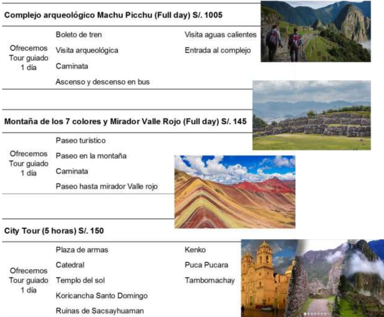
Figura N° 27 Actividades que comprenden las visitas del paquete Energía del Cusco.