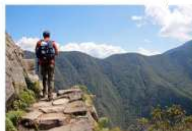
Figura N° 25 Actividades que comprenden las visitas del paquete: Energía Amazónica.