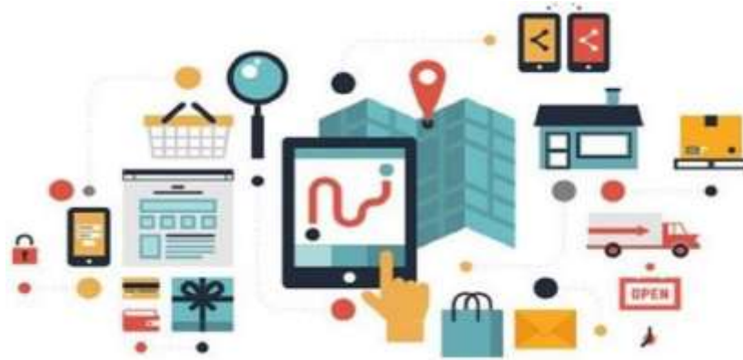
Figura N° 2. Así se entrelazan las plataformas para captar clientes empoderados por la tecnología

La tecnología es un medio que ayuda en la ejecución de algunas labores. De allí que, experiencias tan gratificantes como viajar y conocer diferentes sitios pueden convertirse en el inicio de tales progresos ¿con qué objetivo? consentir que unas vacaciones puedan relajar y liberar el estrés de la vida diaria de los turistas, sin preocuparse por escoger los lugares, qué sitios visitar, o en qué períodos del año.