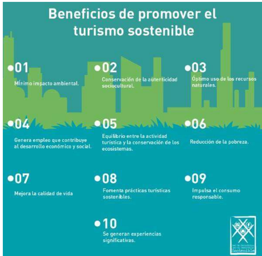
Figura N° 3. Beneficios de promover el turismo sostenible.