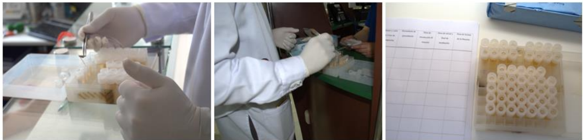
Toma de muestra en las proveedurías de la clínica Odontológica UCSUR