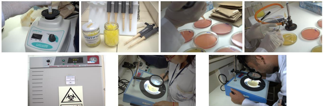
Proceso de siembra de las muestras y lectura de placas