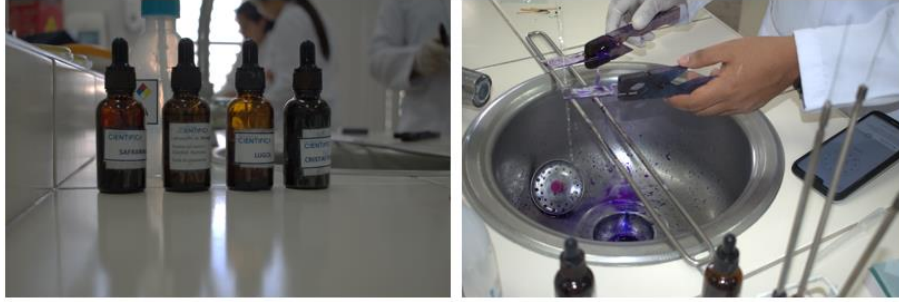
Proceso de tinción Gram