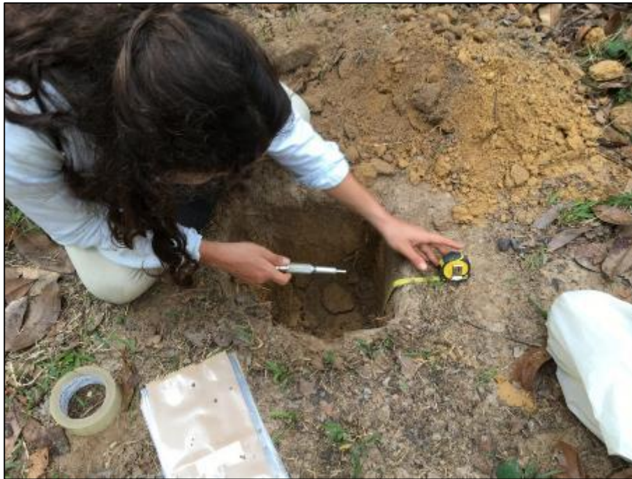
C. Evaluación de la resistencia mecánica del suelo.