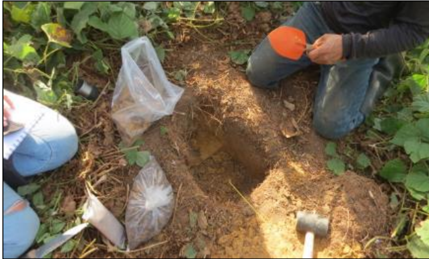
Figura 2. Muestreo de suelos para caracterización.