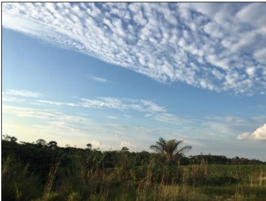
B. Paisaje degradado, sin cobertura arbórea