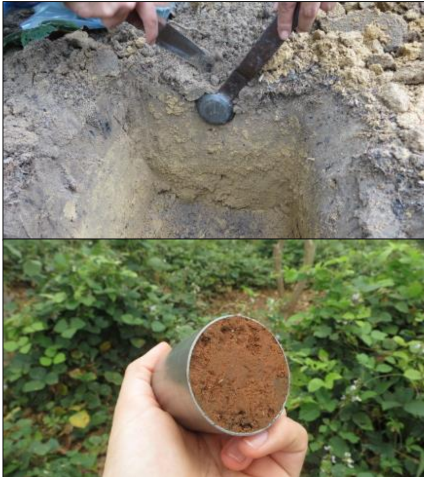
Figura 3. Muestreo de suelos para determinación de densidad aparente.