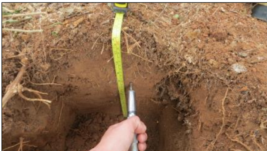
Figura 4. Evaluación de resistencia mecánica de suelo con penetrómetro de bolsillo.