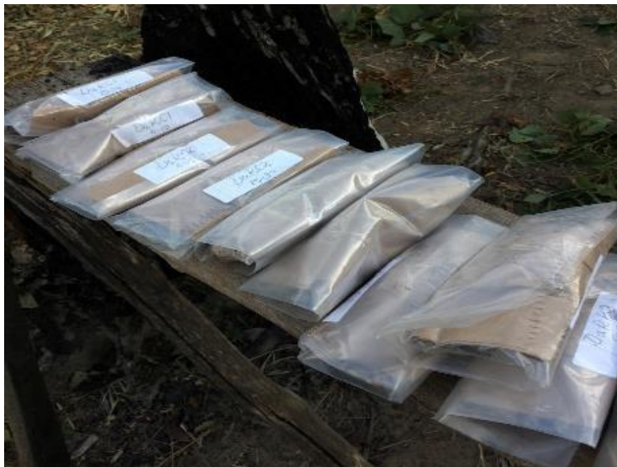
D. Muestras de suelo a ser enviadas a laboratorio para caracterización química, debidamente rotuladas.