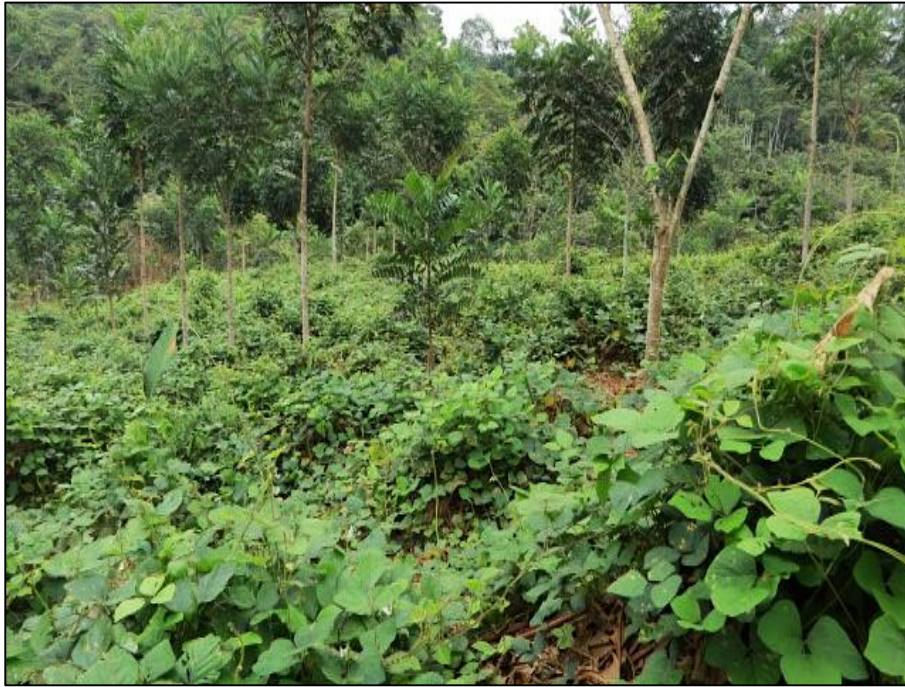
A. Vista de Centrosema macrocarpum en campo.