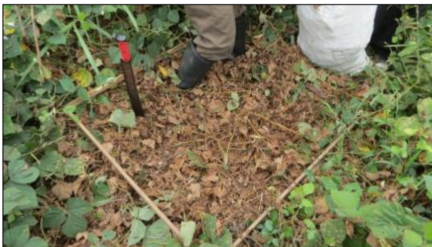
Figura 5. Evaluación de biomasa de cobertura con el método del cuadrante de 1x1 m.

La cobertura de Centrosema macrocarpum (centrosema) que se plantó al inicio del experimento en 2015 y que se evalúa anualmente y repetida 3 veces en cada parcela de cada modelo agroforestal se evaluó con el sistema de cuadrantes de 1 m 2 . Para ello, se colocó en forma randomizada un cuadrante de 1 m x 1 m sobre la cobertura y se procedió a coleccionar toda la biomasa fresca de Centrosema que cabía dentro del cuadrante (Figura 5). Esta fue puesta en sacos y posteriormente pesada, como biomasa fresca total y de aquí se sacó una submuestra fresca en bolsas de papel y fue llevada a laboratorio para colocarla en una estufa de aire recirculante a 75 °C para obtener una submuestra seca . Con estos valores de submuestra fresca y seca se determinó el peso seco del cuadrante de 1 m 2 y se determinó la cantidad de biomasa de materia seca en tonelada por hectárea de cada tratamiento y se hicieron los análisis foliares respectivos para determinar el aporte de nutrientes (nitrógeno y carbono) en esta biomasa de la cobertura.