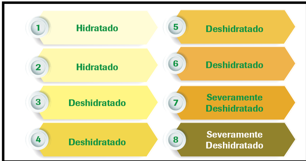
Figura 3. Clasificación del estado de hidratación por colorimetría urinaria

La comparación del color de la orina del atleta se realiza con la tabla colorimétrica de Armstrong et al., 12 figura 3, donde se debe tener en cuenta que, en la toma de la muestra del atleta, debe desecharse la primera parte de la micción y depositar la segunda parte en un recipiente de plástico transparente, para realizar la lectura posteriormente.