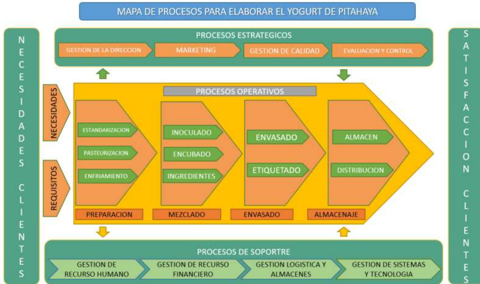
Diagrama de proceso de YOGU DRAGÓN S.A.C