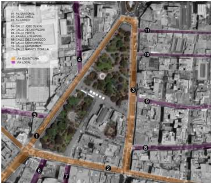
FIGURA 06 TIPOLOGÍA DE VÍA (FUENTE PROPIA, ELABORACIÓN PROPIA)

De las vías estudiadas en el parque Kennedy y sus alrededores se encuentran 2 tipologías de vías, colectoras y locales.