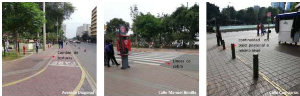
FIGURA 34-35-36 CONTINUIDAD DE PASO PEATONAL Y CICLOVÍA

Para la continuidad de paso peatonal se desarrolla cambio de texturas, uso de líneas de cebras, así como paso peatonal a nivel.