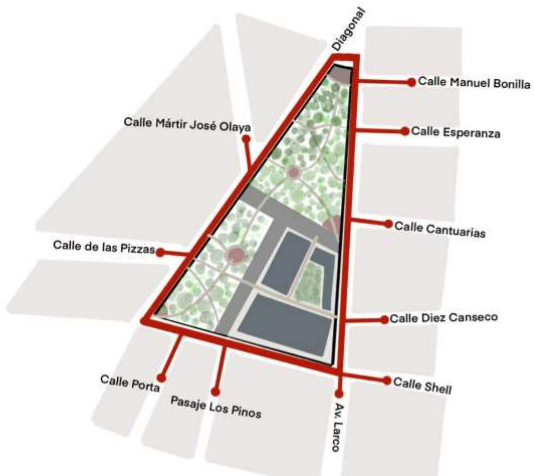
Figura 1 Delimitación de Zona de Estudio