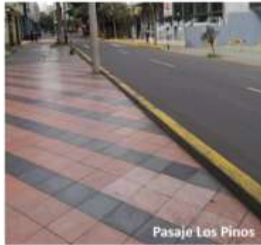
Presencia de bordillos