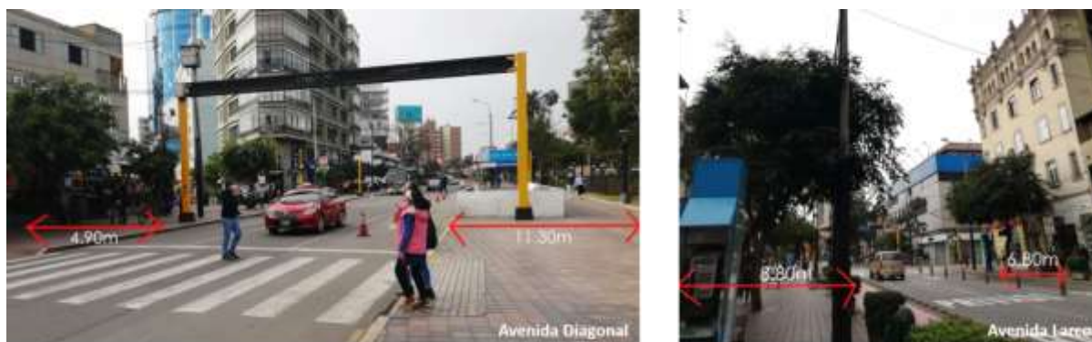
FIGURA 13 ANCHO, NÚMERO DE ACERAS Y CICLOVÍAS (FUENTE PROPIA, ELABORACIÓN PROPIA)

Todas las vías cuentan con 2 módulos de acera, en el caso de Av. Larco cuenta con ciclovía en la lateral que colinda con el parque Kennedy.