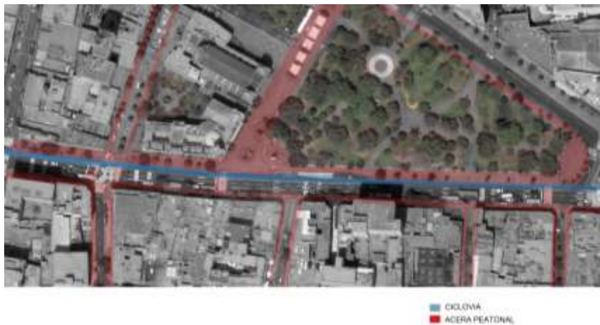
FIGURA 15 CONTINUIDAD DE ACERA Y CICLOVÍA

Las vías estudiadas presentan continuidad tanto en aceras como ciclovías.