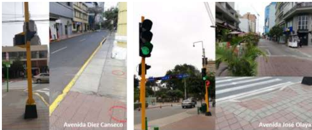
FIGURA 30-31-32-33 TIPO DE PASO PEATONAL Y CICLOVÍA EN CRUCES

Los cambios en pasos peatonales de las vías estudiadas, se desarrollan con cambio de color en texturas, con cruce a nivel; semaforizado y paso peatonal a cruces.