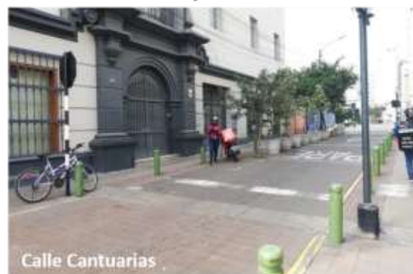
FIGURA 19 – 20 PRESENCIA DE RAMPAS PEATONALES

El nivel de rampas existentes cuenta con una inclinación leve y en algunos casos como Calle Cantuarias las vías se encuentran a nivel.