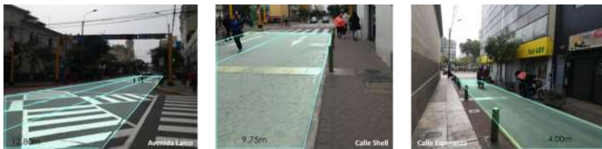
FIGURA 12 ANCHO Y NÚMERO DE CARRILES

Las vías estudiadas cuentan entre 3 a 1 carril, la Av. Larco tiene 3 carriles con 12.80m; Ca. Shell, 2 carriles con 9.75m y Ca. Esperanza con 1 carril de 4m.