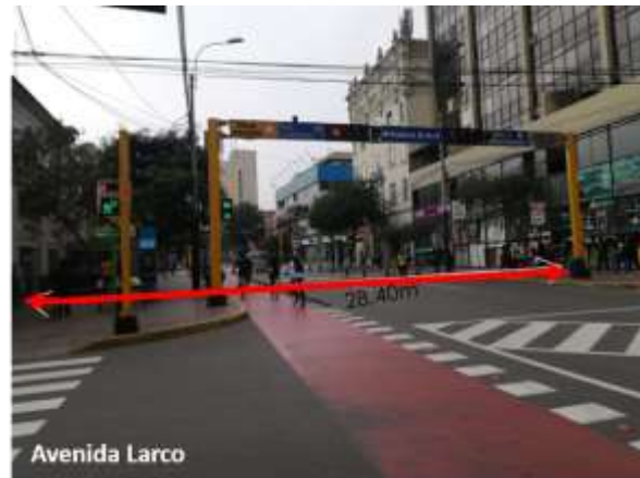
FIGURA 02 ANCHO DE VÍA