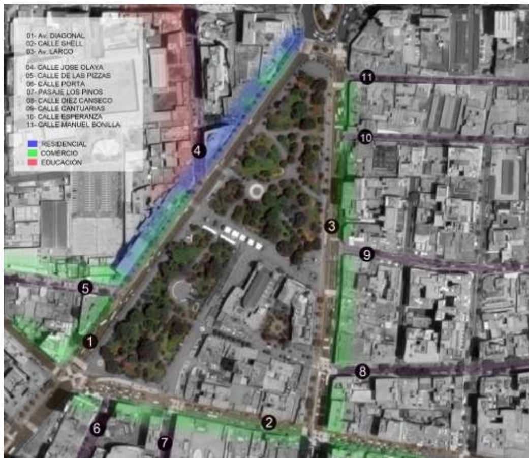
FIGURA 10 INTENSIDAD DE USOS DE SUELO

El parque Kennedy y sus alrededores cuentan con predominancia en uso comercial, seguido de uso residencial y finalmente educacional.