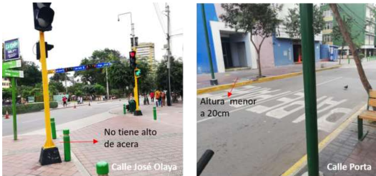
FIGURA 17 – 18 ALTO DE ACERA

Mayormente las vías estudiadas cuentan con un nivel de vereda a +0.20\text{cm} a \pm 0.00\text{cm} .