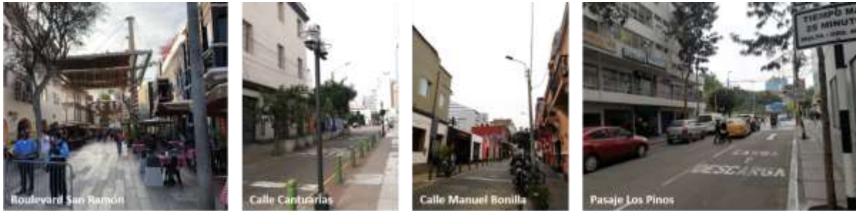
FIGURA 09 CERRAMIENTO DE EDIFICACIONES