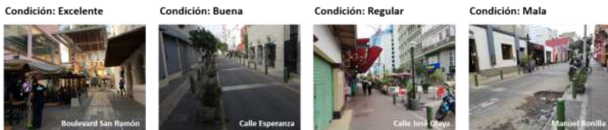
FIGURA 16 ESTADO DE ACERA Y CICLOVÍA

La mayor parte de las vías estudiadas se encuentran en un estado bueno, como la Calle Esperanza, en el caso de Boulevard San Ramón al ser reciente su remodelación se encuentra en un estado excelente; Calle José Olaya, regular y Calle Manuel Bonilla, malo.