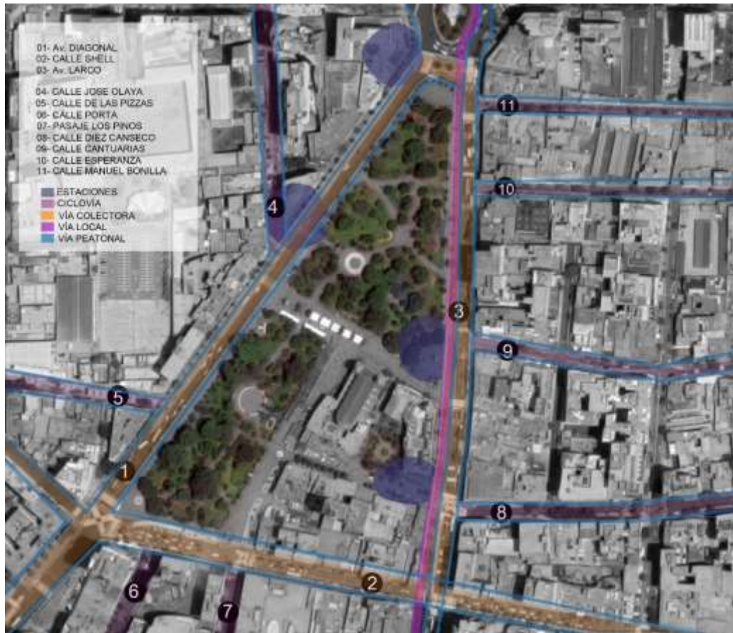
FIGURA 23 TIPOS DE CIRCULACIÓN

Presenta circulaciones vinculadas a las vías existentes en relación al transporte vehicular, sin embargo, carece de una propuesta solidificada.