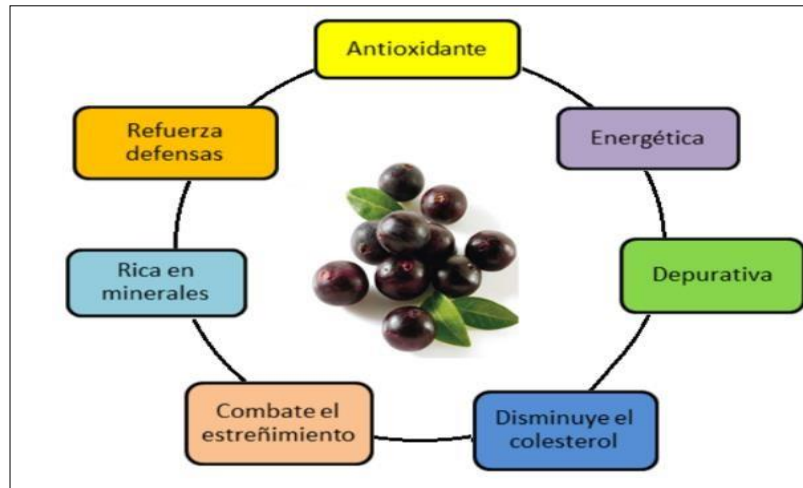
Figura 6 Diagrama con las características del acaí

Nota: Representación de la información relevante del fruto Acaí. Tomado de Exportación de pulpa congelada de Acai , por Kong et al, 2012 ( http://exportacionacaiupc.blogspot.com/ )