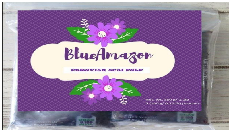
Figura 5 Presentación de pulpa de acaí de 500gr