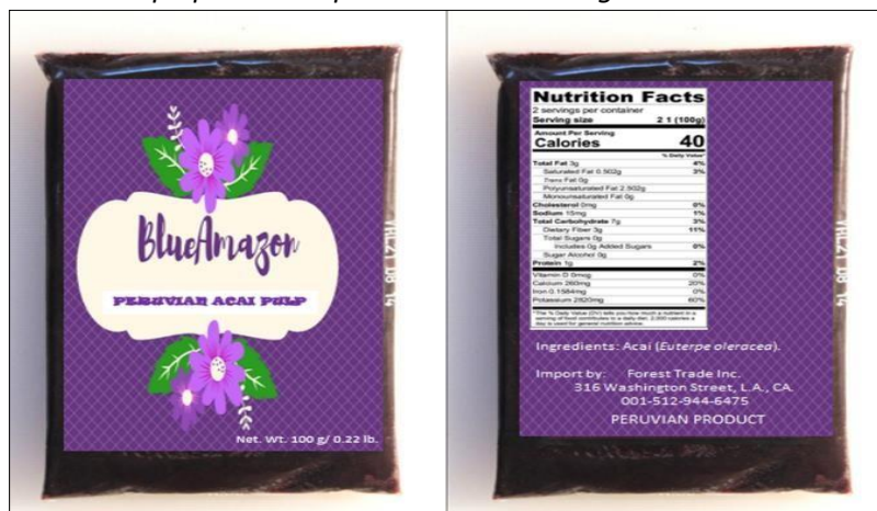
Figura 4 Envase de pulpa de acaí presentación de 100gr

La empresa da a conocer su producto en bolsas de polietileno calibre 2 transparentes de 100gr.