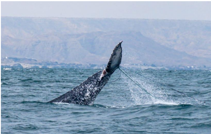
Figura 3. Material fotográfico de ballena jorobada atrapada en red de pesca obtenido en tours de avistamiento de ballenas (agosto del 2017; Los Órganos, Piura).

En este contexto, se ha demostrado que el turismo en espacios naturales brinda oportunidades educativas de conservación y protección, además de oportunidades económicas (Guidino et al., 2020), pero de acuerdo con la bibliografía revisada, existe una visual perturbación en el comportamiento de la población objetivo y su supervivencia se puede ver afectada no sólo por esta actividad, si no también por redes de pesca o cabos náuticos de pesca que se encuentran sueltos en el mar (Fig 3). Todo ello, puede influenciar en la experiencia del turista como resultado de una mala gestión al momento de observar que el individuo avistado, trata de esquivarlos o evitarlos.