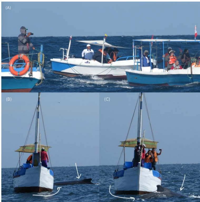
Figura 1. Material fotográfico obtenido en los tours de avistamiento de ballenas (julio - agosto del 2016 – 2018; Los Órganos, Piura). (A) Aglomeración de embarcaciones de avistamiento de ballenas sin formar una línea paralela (línea de tren) con el individuo avistado. (B,C) Persecución de ballena jorobada en círculos causando una perturbación en su comportamiento y dirección de nado, las flechas indican la ubicación de las ballenas.

Actividades que influyen en los cambios de comportamiento de las ballenas jorobadas han sido evidenciadas en el norte del Perú (Figura 1).