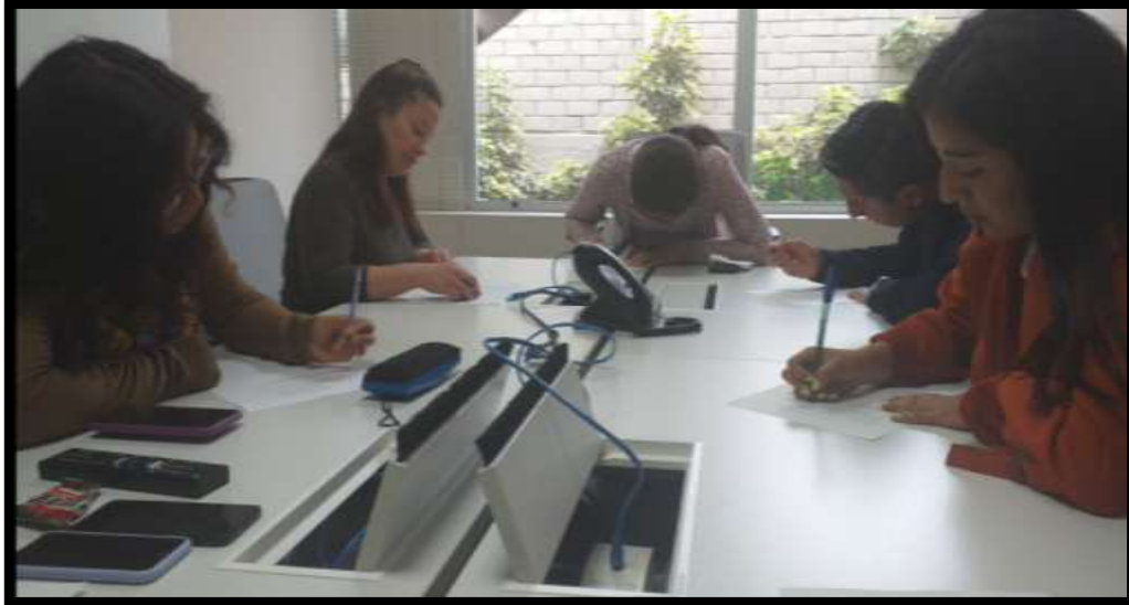
Llenado de Cuestionario CVS-Q