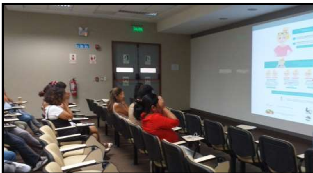
Realización de pausas laborales