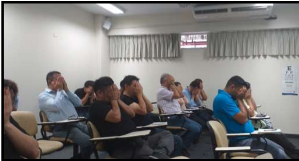
Realización de pausas laborales