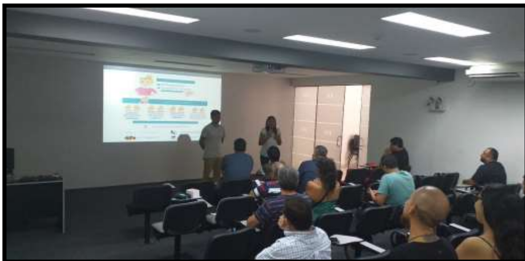
Realización de pausas laborales