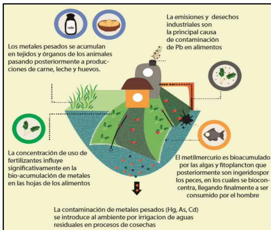
Figura1. Principales fuentes de contaminación por metales pesados.

Desde la revolución industrial se ha liberado gran cantidad de metales al medio producto de intensificación de las actividades como la minería, metalurgia y agricultura (Beltrán & Gómez, 2016). Así, diversos estudios reportan la bioacumulación y biomagnificación de metales pesados en plantas, mamíferos, peces y aves, pues la gran mayoría estos elementos no pueden ser degradados biológicamente al carecer de funciones metabólicas específicas (Prieto et al. , 2009). En la figura 1 se muestran las principales fuentes de contaminación por metales pesados y su ingreso a la cadena trófica (Reyes et al. , 2016).