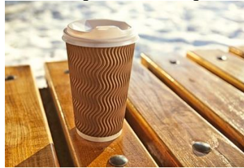
Figura 3 Café Orgánico

Nuestro producto final será 100% orgánico para poder tener diferentes formas de presentación como: Americano, Latte , Mokaccino , Chocolate caliente para épocas calurosas como verano vamos a implementar té frío para poder comercializar. Con el tema de postres habrán variedad, como pie de limón, empanadas de diversos sabores, muffin, triples mixtos, etc.