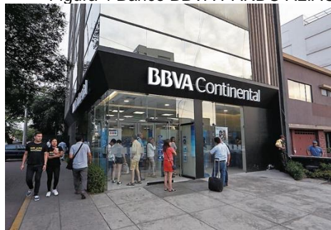
Figura 4 Banco BBVA PARDO ALIAGA

Nuestro local se encontrará en el distrito de San isidro en la oficina BBVA PREMIUM que se encuentra en Pardo y Aliaga en la mejor zona exclusiva donde estamos enfocados nuestros producto.