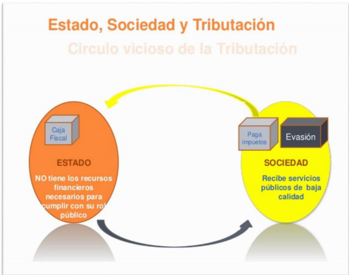
Ilustración 2. Círculo vicioso de la tributación