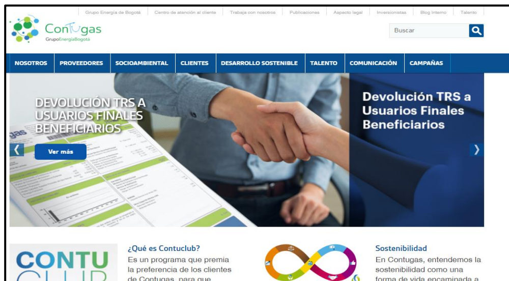
Figura 3. Página Web CONTUGAS S.A.C.

La página web, cumple el objetivo de fidelizar a los clientes y conseguir a nuevos de ellos. Por otra parte ayuda a que la empresa sea visible en los buscadores de internet, ya que es necesario contar con estos para el contacto constante con los clientes para que ellos puedan consultar en cualquier momento o ver los servicios y promociones que tiene la empresa a cualquier hora, ya que la empresa quiere generar un proceso de feedback con sus clientes con el cual ellos puedan dejar su opinión, dudas o quejas sobre algún servicio brindado por la empresa, ya que es importante respetar todas las opiniones y estar atentos a todos los casos.