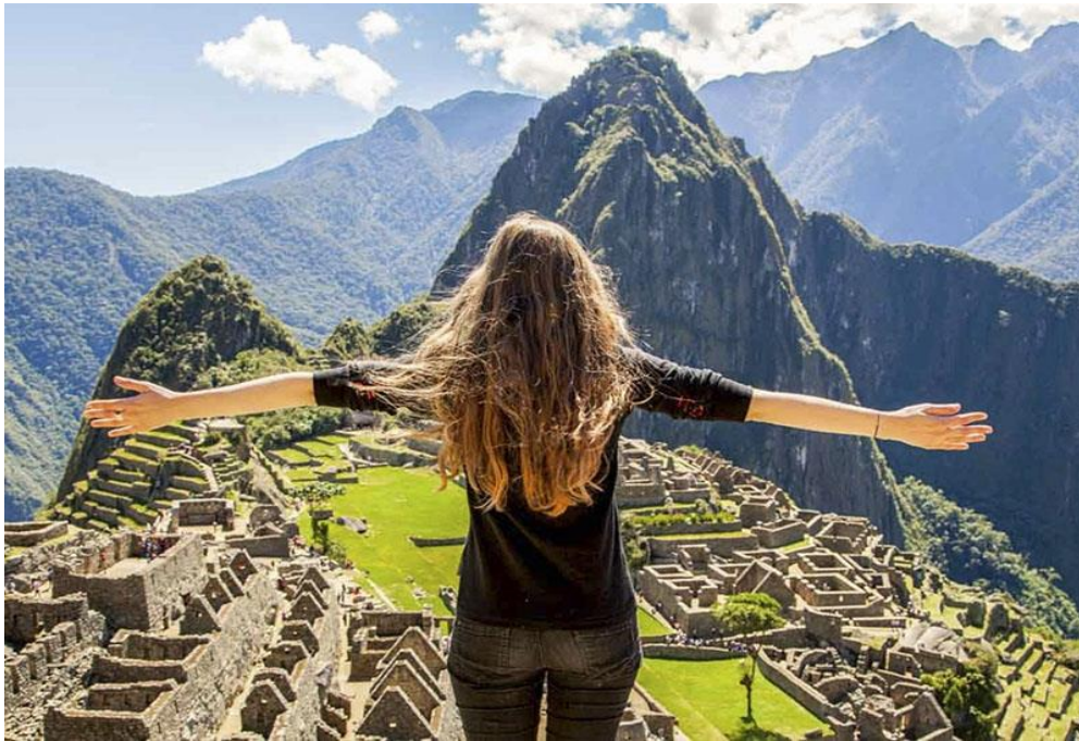
(Figura 2: Interactiva Digital)

Irismedia es una agencia de publicidad y medios española, que se encarga de ofrecer servicios plenos en comunicación, así como en marketing digital. Hace aproximadamente 2 años, realizó una campaña conjunta a Influencers de distintos países de Europa para promocionar diversos destinos del Perú en un viaje que duro más de una semana. Ellos compartieron sus vivencias a través de sus medios sociales a los miles de seguidores con los que interactuaban. “Una campaña que no sólo generó emociones y deseos, también más de 14MM de usuarios, 90MM de impactos y una permanencia en el tiempo de una campaña que no ha hecho más que comenzar”. (Interactive, 2019)