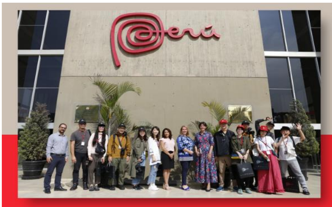
(Figura 4: Portal de Turismo)

A finales de marzo del presente año, llegaron a la capital un total de seis influencers procedentes de Taiwán, como parte de un convenio entre la Oficina Comercial del Perú en Taipéi (OCEX Taipéi) y Sony Taiwán. “El objetivo es promocionar nuestro país como destino turístico y promover el nuevo modelo cámara fotográfica de la empresa respectivamente”.