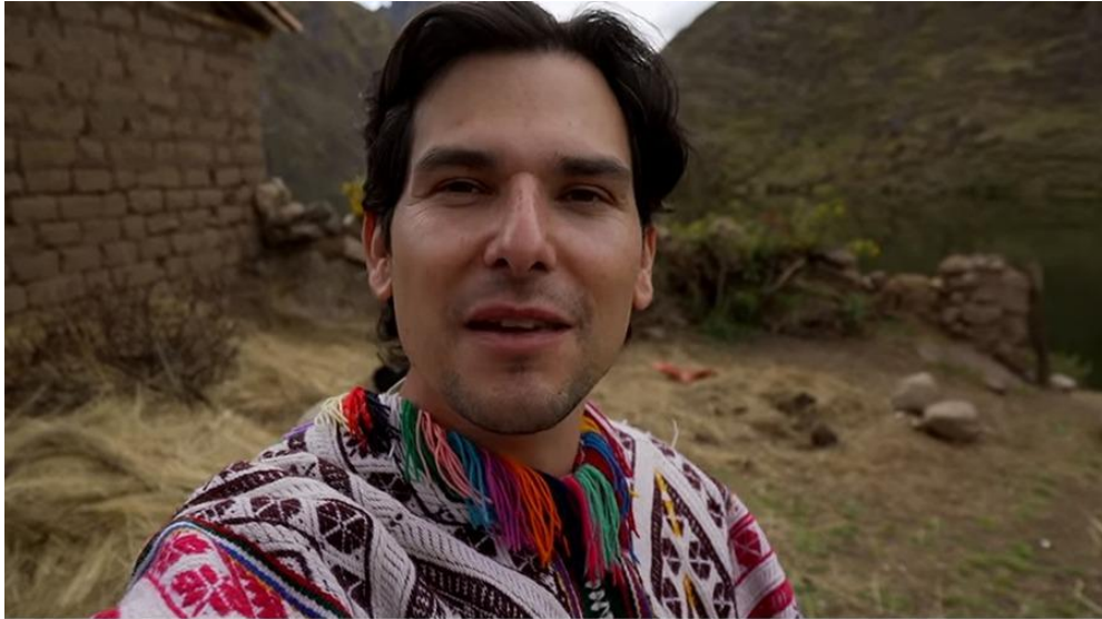
(Figura 3: PromPerú)

“Para incentivar que viajeros extranjeros retornen más de una vez a nuestro país, seis influencers de América Latina compartieron con millones de seguidores de sus redes sociales los diversos atractivos turísticos de Perú” (Perú, 2018). Esa es la intención de esta extraordinaria campaña hecha con Influencers de América que PROMPERU puso en marcha.