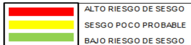
Figura 2: Evaluación del riesgo de sesgo de las intervenciones, discernidas por los autores.