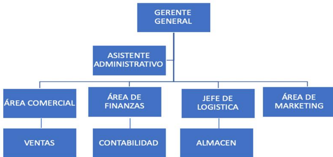
Grafico 9.1. Organigrama de la empresa

Se ha diseñado un organigrama del tipo vertical funcional. En este organigrama se pueden apreciar cuatro áreas funcionales.